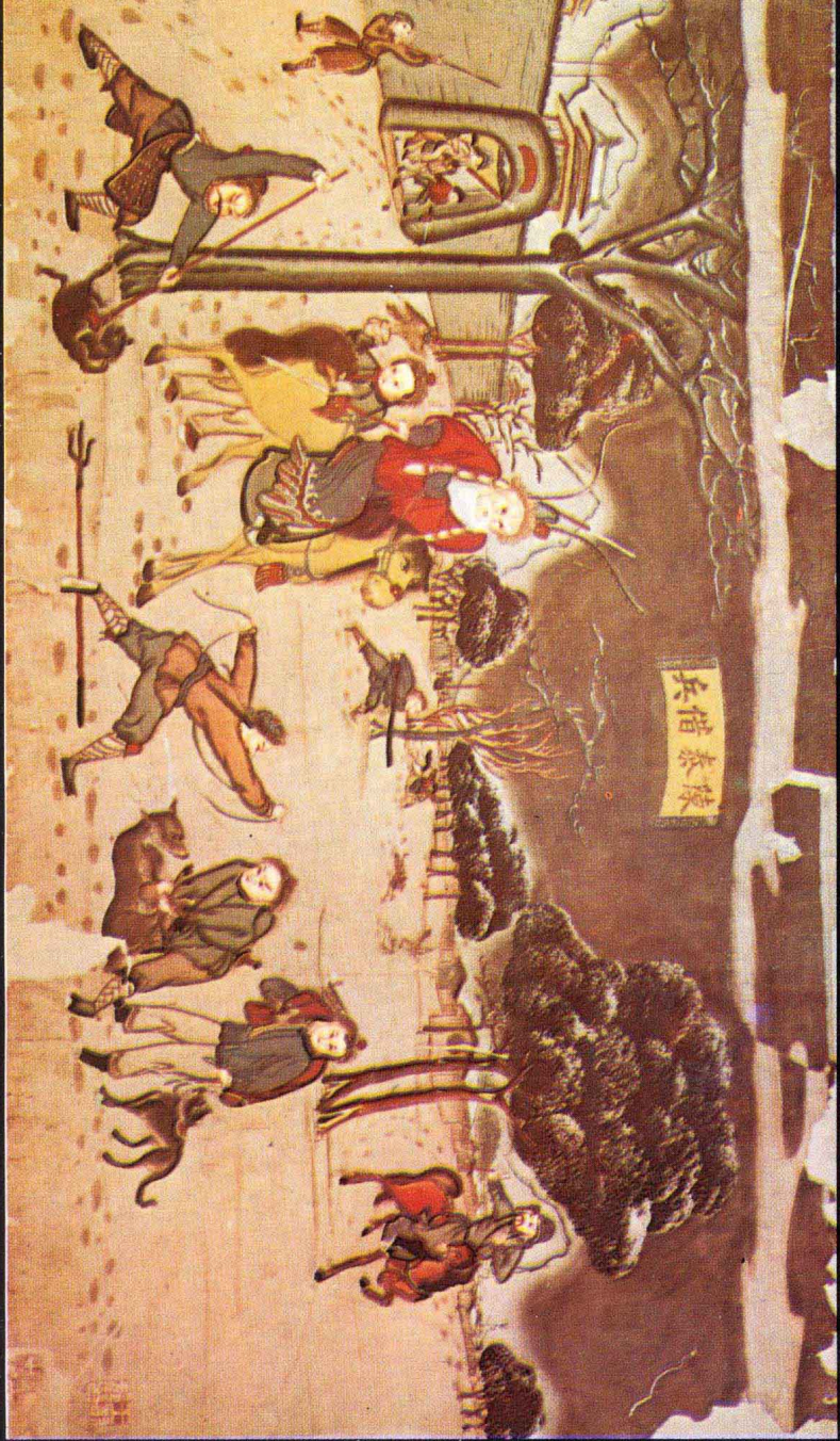
戴笠子，披狗尾的是丑霸王送匾。