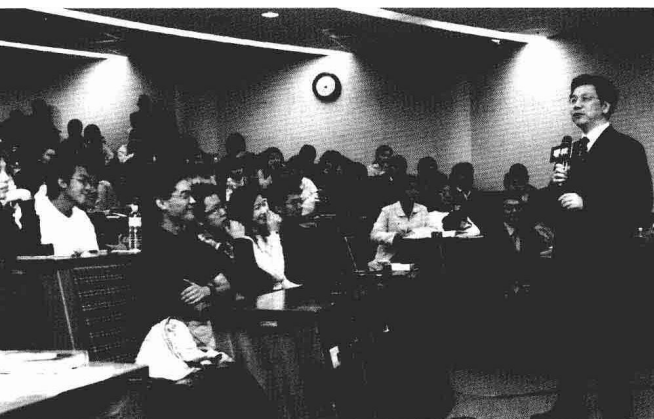
透過演講、寫書，希望這個社會能更加關心年輕人的生存處境和成長煩惱。

念）。同時，國內的應試教育占用了學生大量的時間，進入大學後根本沒有多餘的精力和時間再接受課業學習以外的磨練，由於得不到成長，碰到挫折後往往不知所措。還有些學生對自己的學校非常不