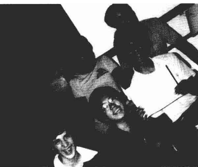
自大二起，我就把「發揮影響力」當作人生目標。

在與青年學生交流的過程中，我深深地感受到，現在有相當多的青年朋友因為四個原因而焦慮、苦惱，甚至迷失了方向。我從眾多提問中挑選了一些比較具代表性的問題，放在本書第1章，用來印證以下四個原因。