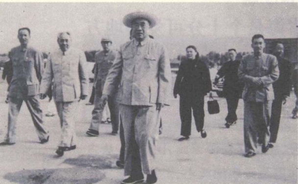
朱德同志视察青海