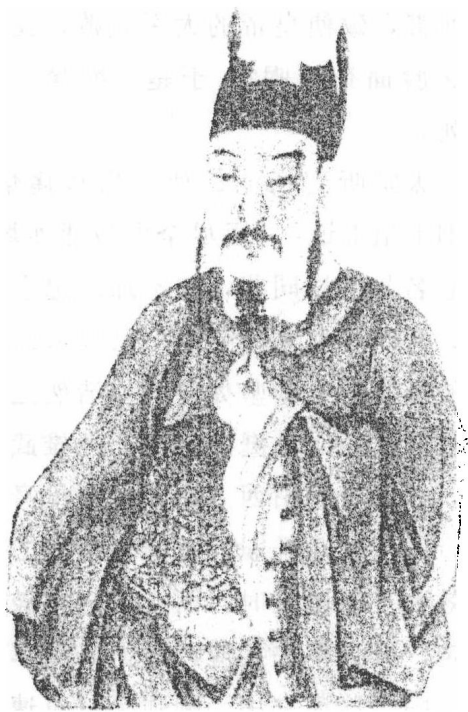
曹彬，字国华，真定灵寿人，出身将门。

当将军打仗，不过就像老鹰和猎犬去追逐野鸡和兔子罢了。”杨业早年在北汉主刘崇手下做官，以骁勇闻名，他经多次提升，官至建雄军节度使，并被赐名“刘继业”。他每次打仗都能克敌奏捷，因此北汉百姓称他为“杨无敌”。