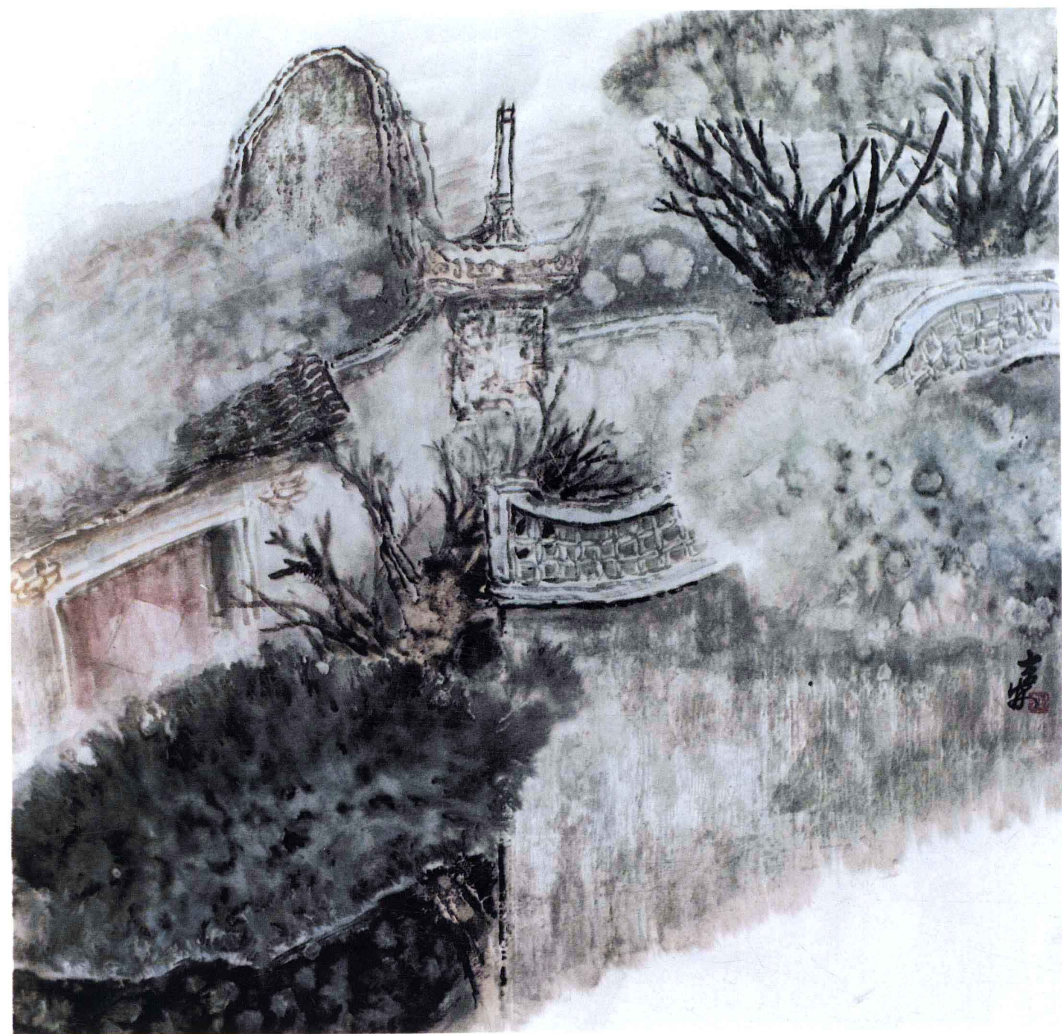
6. 三坊七巷一角 69×69