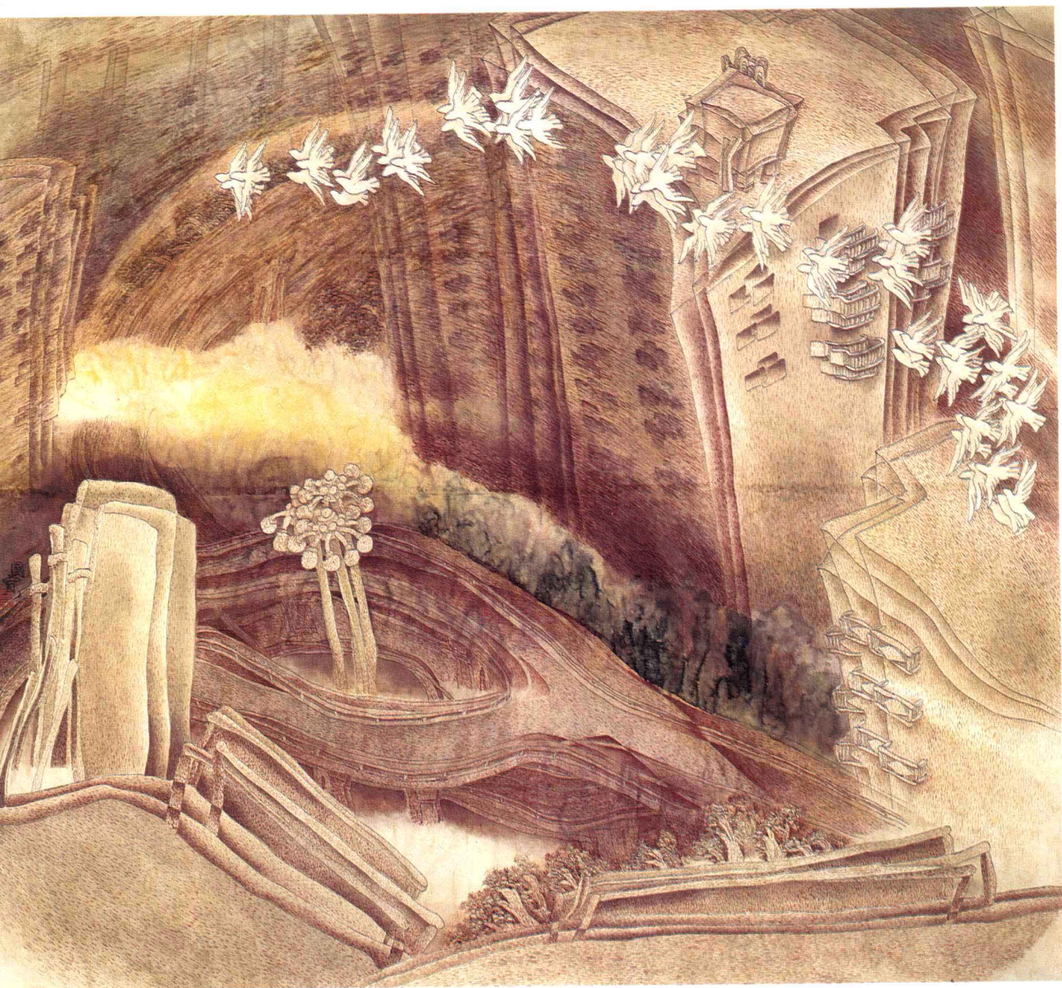
1. 家园难觅 114×124