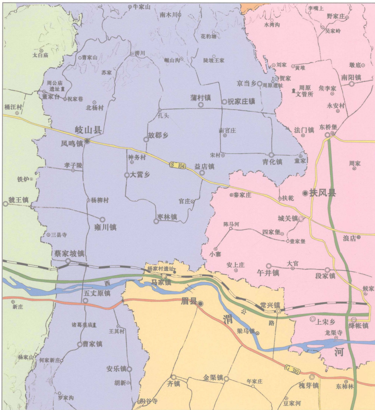
图一 眉县杨家村地理位置示意图