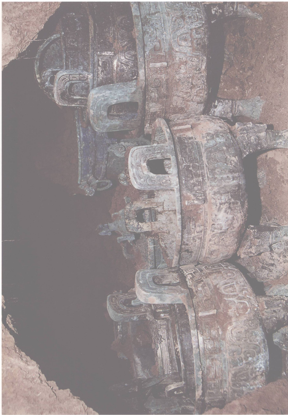
图四 窖藏青铜器出土情况