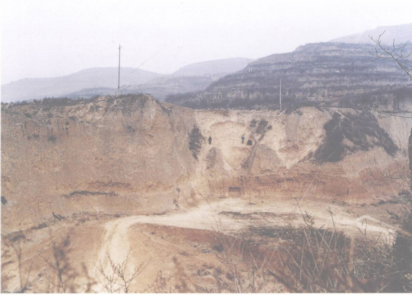
图二 杨家村青铜器窖藏远眺

杨家村位于眉县马家镇东北，渭河北岸二级台塬上，大周原的南缘，西北距岐山县城约16公里，东南距眉县城4公里。东为李家村（杨家村的一个自然村），西为马家村。北靠北塬，宝鸡峡引渭渠自西向东穿过北坡，