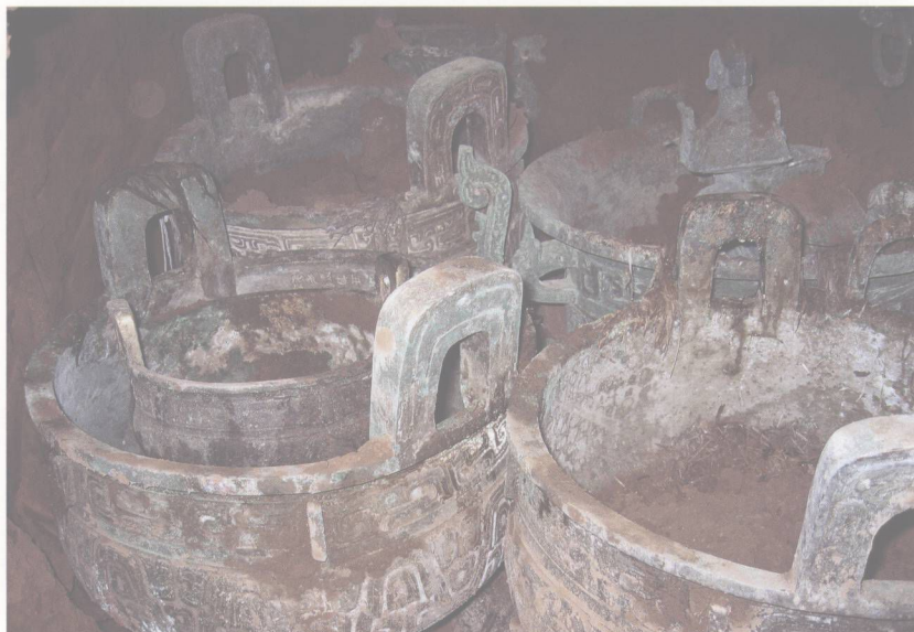
图五 窖藏青铜器出土情况