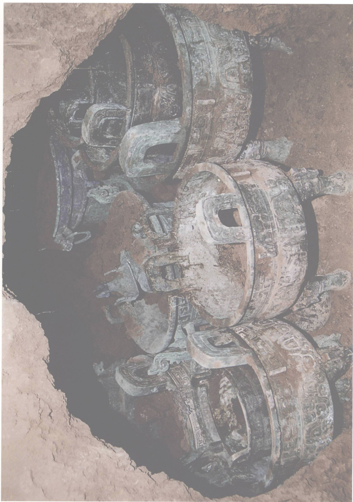
图六 窖藏青铜器出土情况