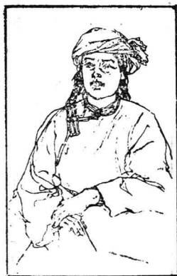
胸像速写(程十发 作)