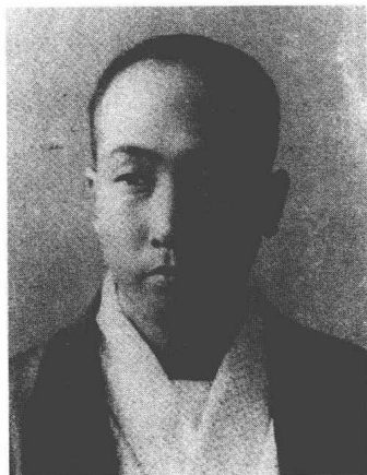
大正十五年夏，摄于住所附近的神乐坂照相馆，这一年乱步正式投身于推理小说的创作。