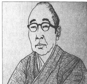
江戸川乱歩 Edogawa Ranpo (1894—1965)