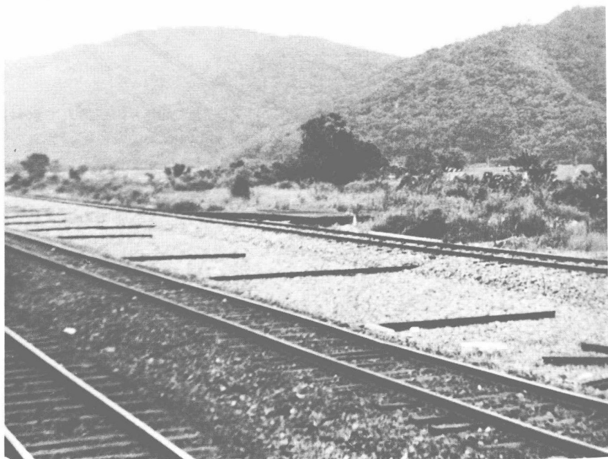
由北迴線鐵路武塔火車站遠望龜山，山頭圓鈍可親。（楊極峰）