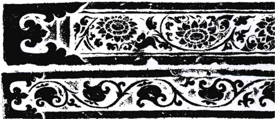
图 1-06 长沙杨家山南宋墓出土石刻墓志花纹

五代墓中出土石砚上一般线刻制砚人的姓名或售价，宋墓所见石砚也如出一辙。另有石雕子母口圆盒，其盖上也以细线阴刻花草。长沙杨家山南宋墓中出土石质墓志一块，背面下部线刻圆胖脸、衣长及足的人像，左边和下面刻有莲花、忍冬纹和卷枝花叶（图 1-06），由于该墓志线刻纹样所表现出的刚劲活泼之势带有明显的唐代遗风，考古工作者推断“此志是利用唐代的石刻加以琢磨而成” ⑥ 。1973 年在衡阳县何家皂山发现的北宋墓还出土一套完整的石椁 ⑦ ，也是湖南发现的最早、最完整的一套石椁。宋元时期，湖南已经出现全部由石料筑造的石室墓，1976 年 2 月发掘的常德北宋张颺夫妇墓 ⑧ ，墓室全用长方形石料叠砌而成，两室墓底上的中间有用长方条形石块铺成高出墓底 12 厘米的棺床，在东、西两室的进口处，各设置一道由门框、门扉和门楣构成的墓门，门框的两边为两根石枋垒叠的立柱，两边立柱上承放有门楣，门楣上有一横条石，横条石上有一呈弧形的石枋，立柱下端置于横石门槛上。两室四扇门扉的正面上半部均以墨线、朱色和白粉彩绘形象相同、画面大小一致的甲冑武士立像，下半部则浅浮雕动物图像，也分别涂绘与上部武士像一致的彩色颜料。此外，拱券式结构的砖石墓还有明荣