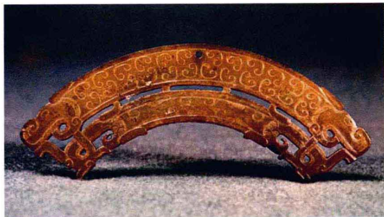
图 1-03 战国镂空双龙纹玉璜