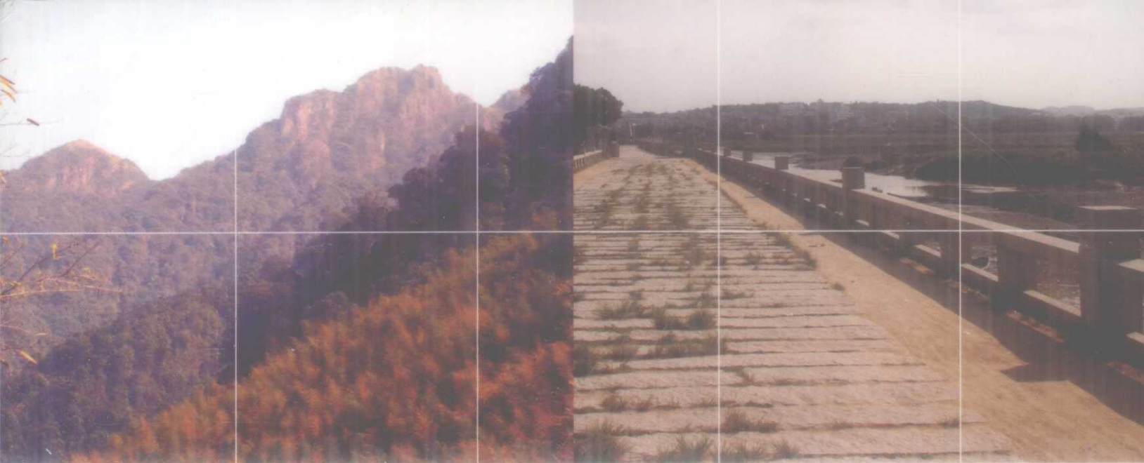
圖 上四州之人輕揚下四州人較厚 朱熹語錄 閩有負海 州其地多溪山之險福泉漳化號下四州其地坦夷 朱熹語錄 閩有負海 經 上四州之人輕揚下四州人較厚 朱熹語錄 閩有負海 海濱之上登及洙泗如閩中八郡建劍汀邵號上四 歐陽詹林蘊咸登于朝 州其地多溪山之險福泉漳化號下四州其地坦夷 朱熹語錄 閩有負海 圖 上四州之人輕揚下四州人較厚 朱熹語錄 閩有負海 海濱之上登及洙泗如閩中八郡建劍汀邵號上四 歐陽詹林蘊咸登于朝 州其地多溪山之險福泉漳化號下四州其地坦夷 朱熹語錄 閩有負海 經 上四州之人輕揚下四州人較厚 朱熹語錄 閩有負海 海濱之上登及洙泗如閩中八郡建劍汀邵號上四 歐陽詹林蘊咸登于朝 州其地多溪山之險福泉漳化號下四州其地坦夷 朱熹語錄 閩有負海 圖 上四州之人輕揚下四州人較厚 朱熹語錄 閩有負海 經 上四州之人輕揚下四州人較厚 朱熹語錄 閩有負海