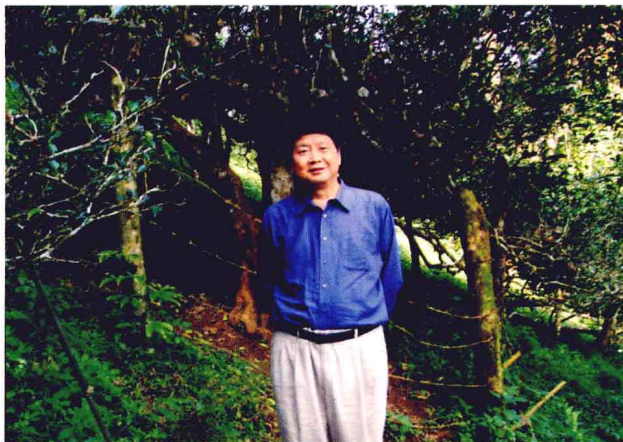
作者在“茶树王”前留影

茶树王树高5.5米，树幅10米，主干直径138厘米，叶片大，叶长15厘米、宽6.3厘米。据历史资料考证分析，树龄约有800余年，是世界上保存完整的古老大茶树，匍匐大地，枝叶苍郁，犹如华盖。这引起了国内外茶叶科学工作者的极大兴趣，前往观光与考察者络绎不绝。笔者在2006年9月和全国人大农委的同志前往实地考察，当时汽车只能停在山下，还要走