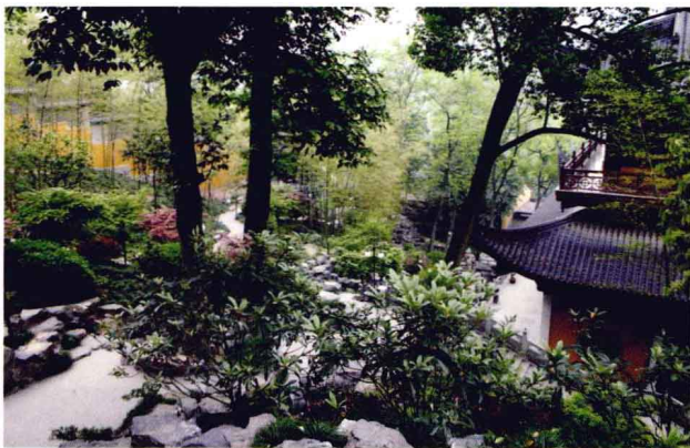
径山茶、龙井茶都是在寺院附近出产

在春秋战国后期及西汉初年，我国历史上曾发生几次大规模战争，人口大迁徙，特别在秦统一四川以后，促进了四川和其他各地的货物交换和经济交流，四川的茶树栽培、制作技术及饮用习俗，开始