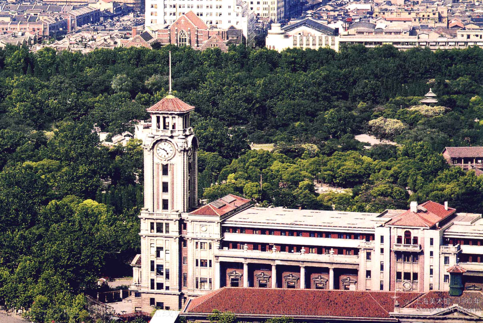
上海美术馆 1980年 Shanghai Art Museum