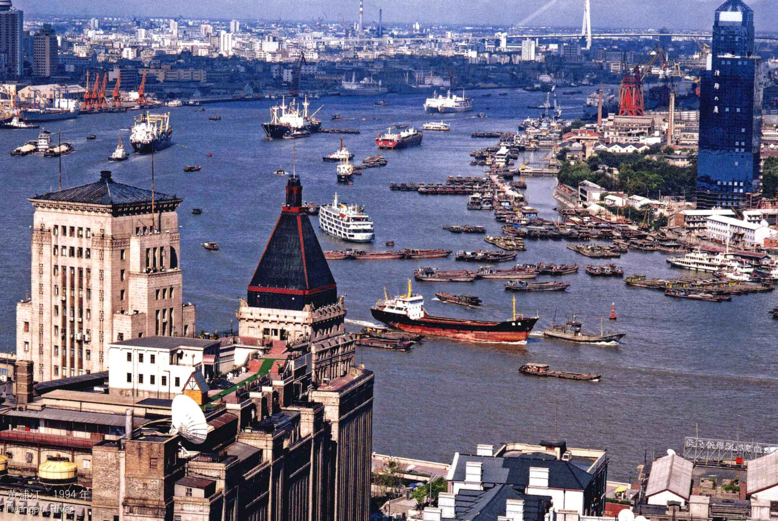
黄浦江 1994年 Huangpu River