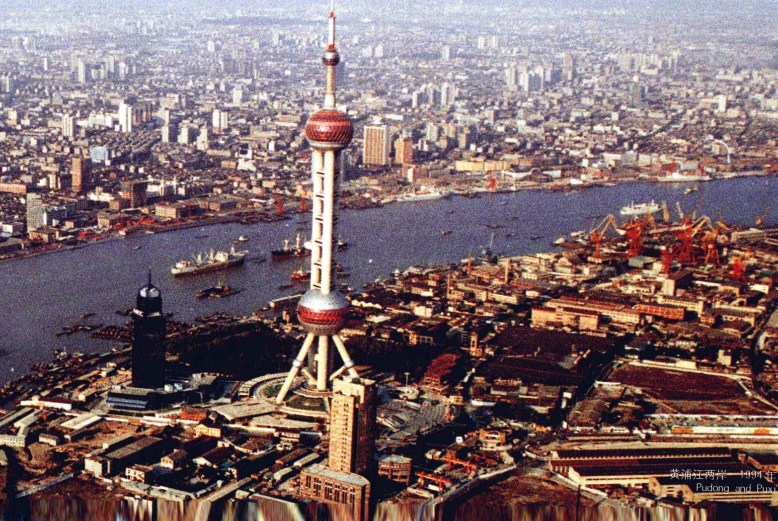
黄浦江两岸 1994年 Pudong and Puxi