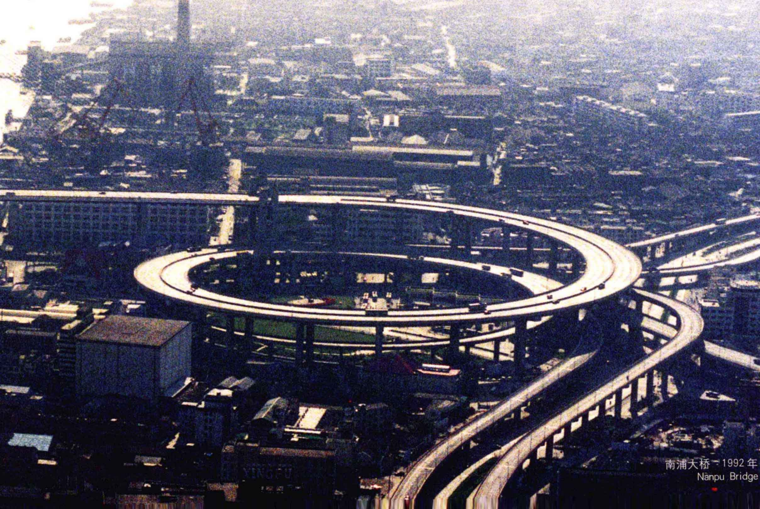
南浦大桥 - 1992年 Nanpu Bridge