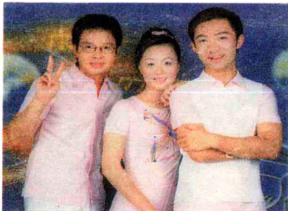
地震动摇不了我们的意志！

原来晓光逃生的反应过于灵敏，却把逃生的方向弄反了，还连带把这层楼的居民全部带进了死胡同。等到大家都发现跟着白短裤犯了一个致命的错误，逃生的队伍立刻统统向后转，白色短裤立刻由领队变为押队，跟在队伍后面朝楼下冲去。这也可以说是上天照应“开心 100”主持人，倘若