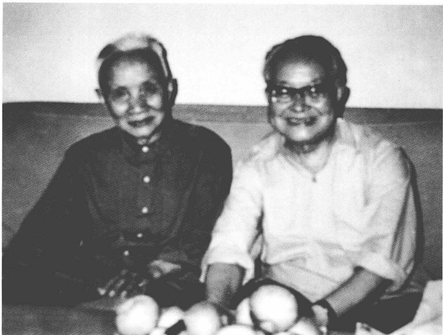
1982年6月下旬与朱光潜在全国文联第四届二次会议中