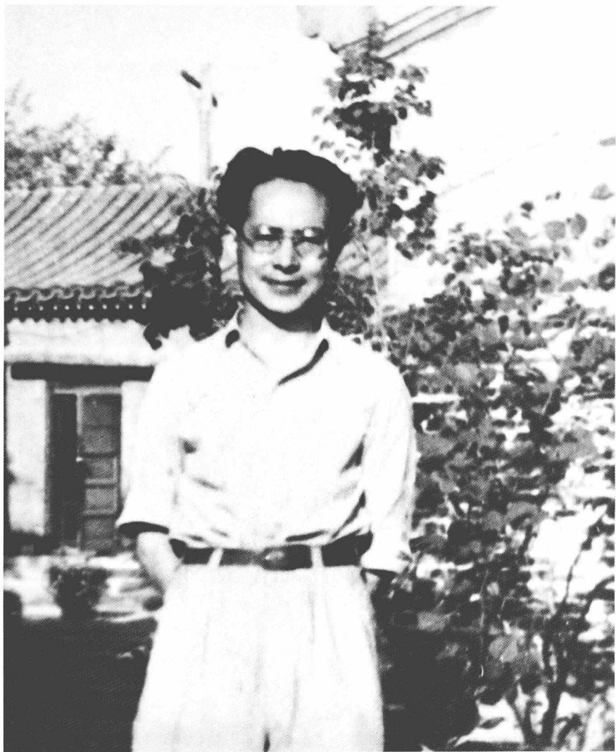
1948年夏在北京大学宿舍