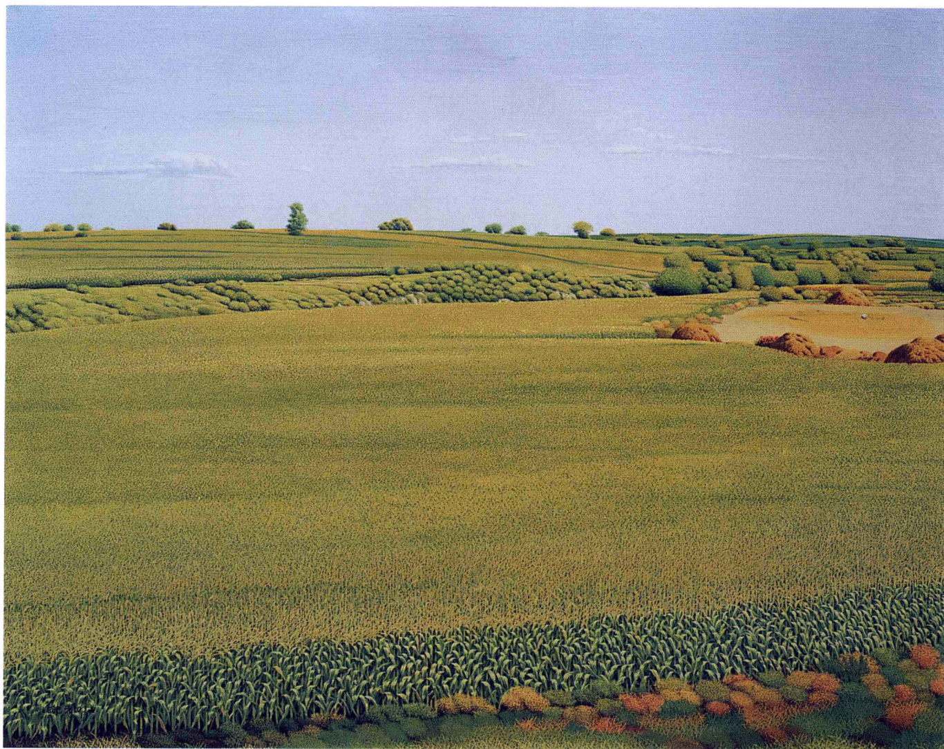
© 玉米地 2003年 布面油彩 72.7cm × 116cm