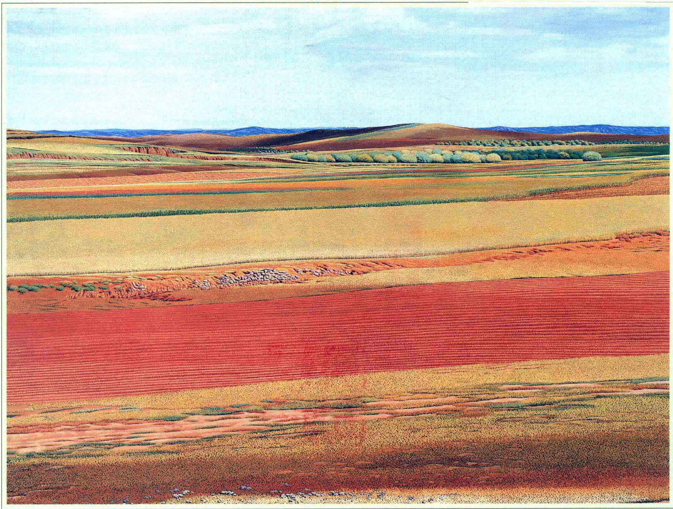
© 圣地 2003年 布面油彩 97cm × 130cm