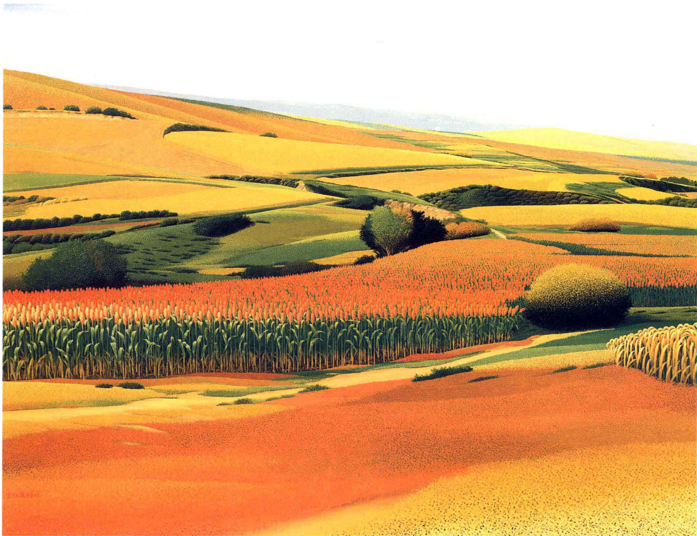
© 塞外风景 1998年 布面油彩 97.5cm × 130cm