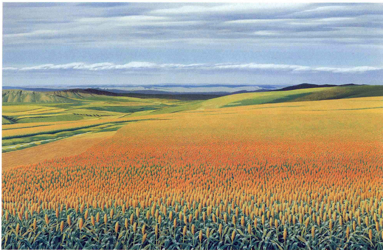
© 秋天 2004年 布面油彩 85cm x 130cm