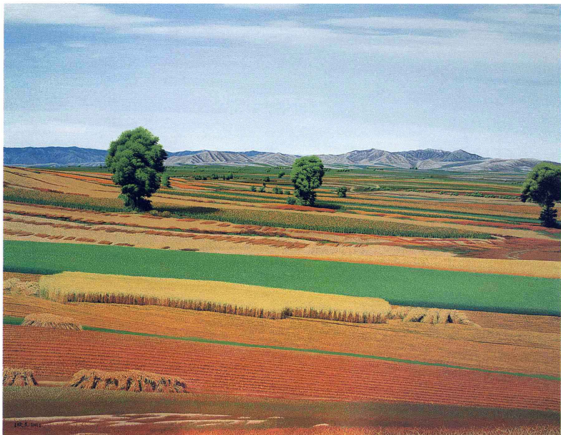
© 坝上莜麦地 2002年 布面油彩 91cm × 116cm