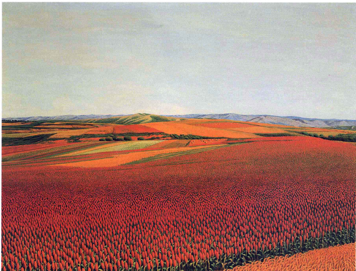
© 秋收季节 2001年 布面油彩 97cm × 130cm