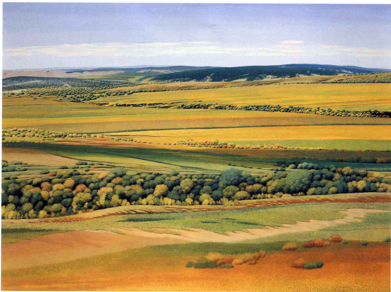
© 九月风景 2003年 布面油彩 97cm × 130cm