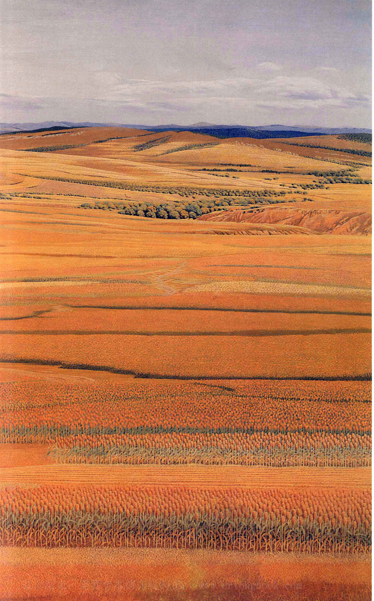
© 北方深秋 2002年 布面油彩 97cm x 130cm