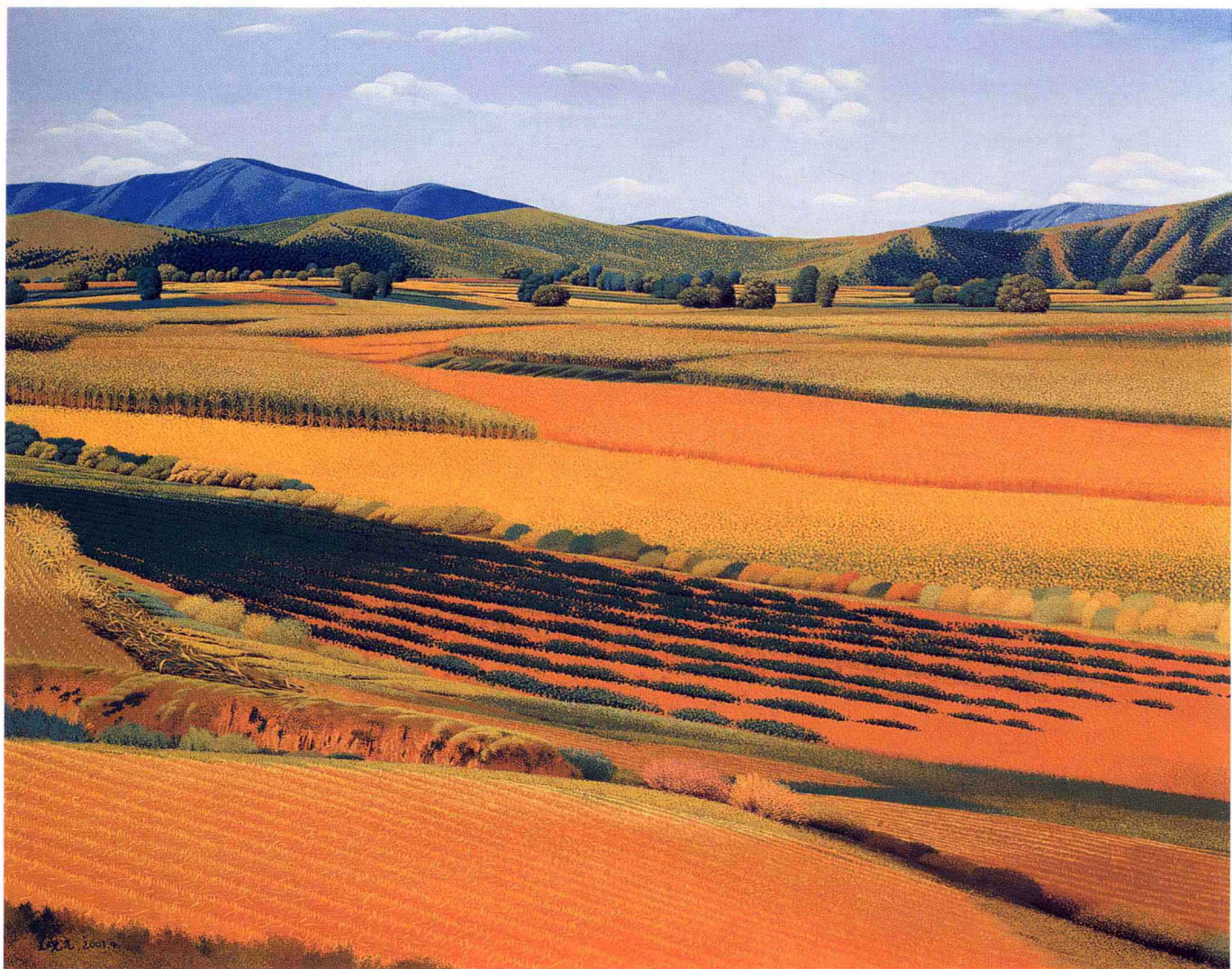
© 丘陵地带 2001年 布面油彩 91cm × 116cm