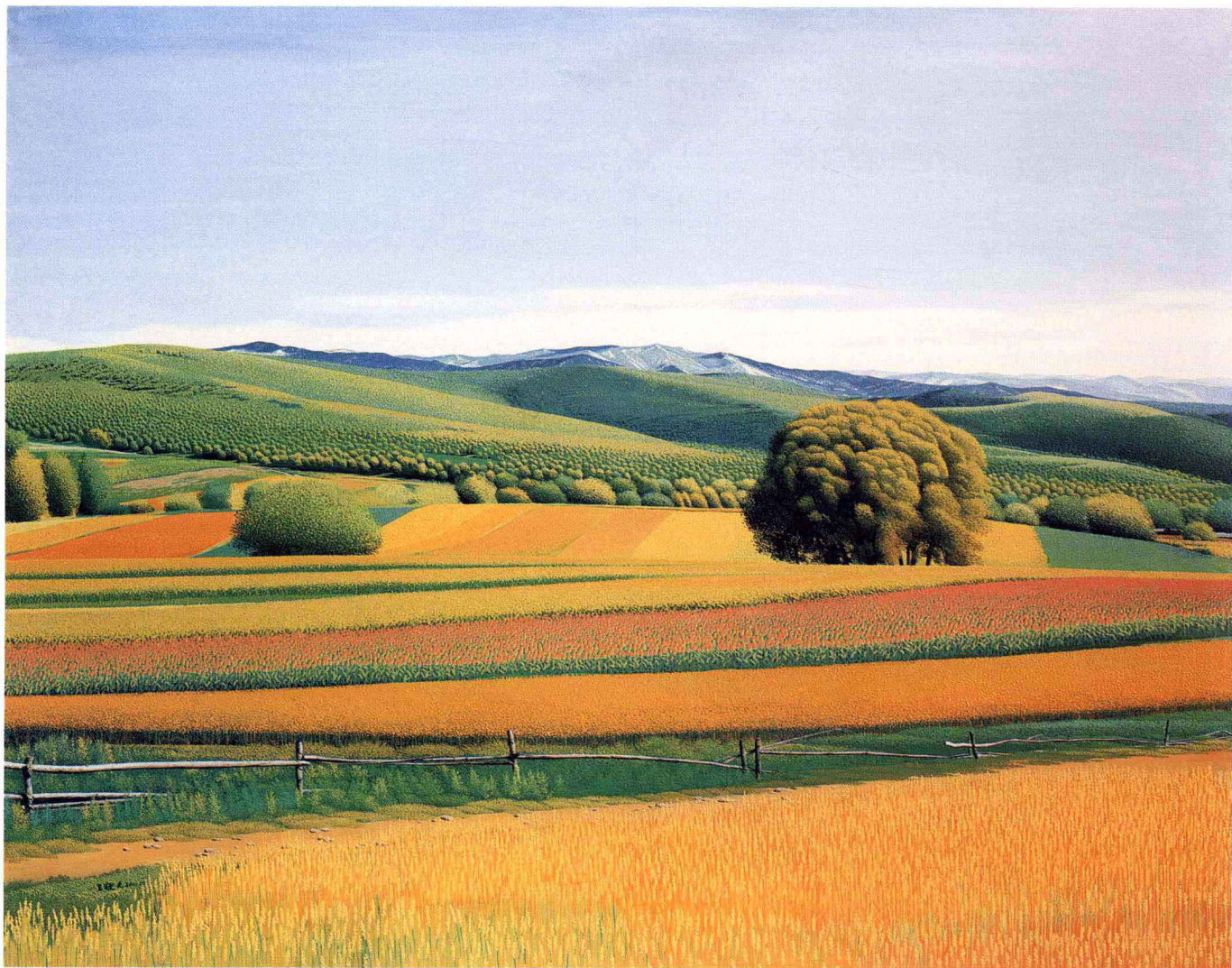
◎ 有围栏的风景 2001年 布面油彩 91cm × 116cm