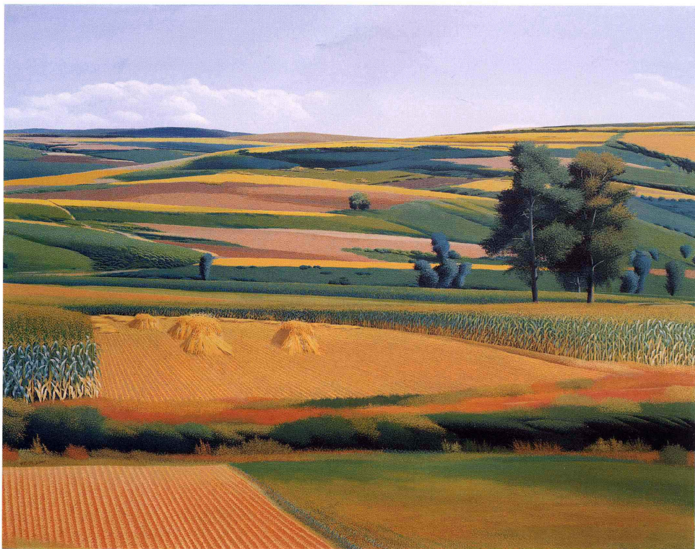
© 秋日田野 1999年 布面油彩 116cm × 97cm