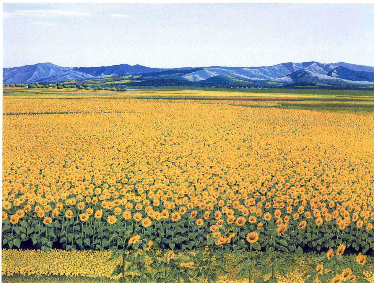
© 葵花 2000年 布面油彩 97cm x 130cm