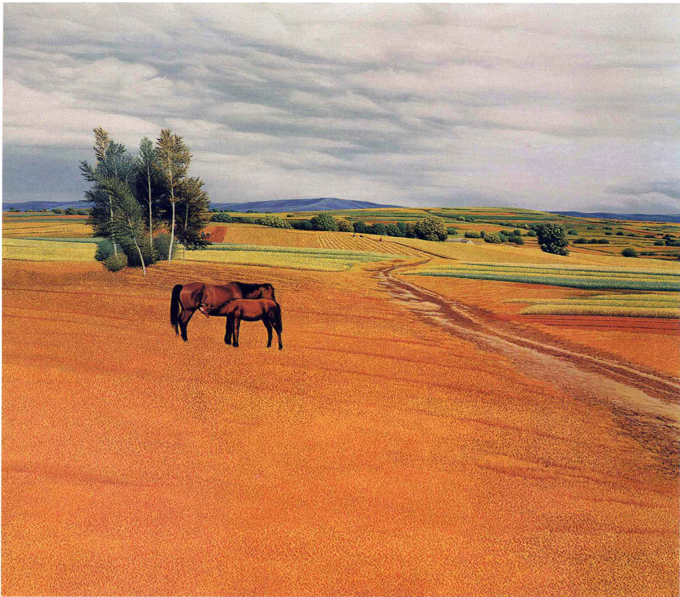
© 家园 2002年 布面油彩 93cm × 107cm