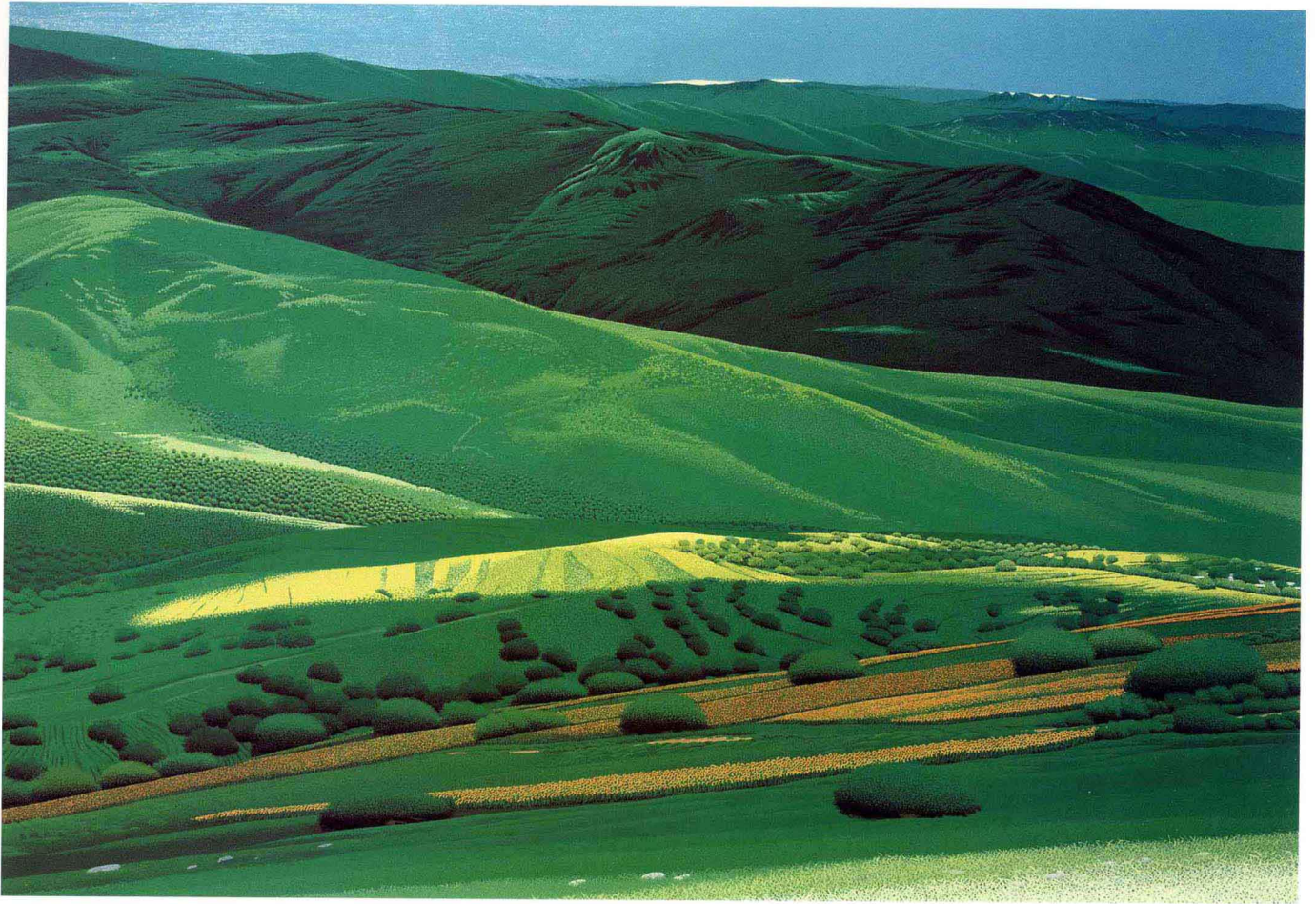
© 夏·远山 1997-2000年 布面油彩 112cm × 162cm