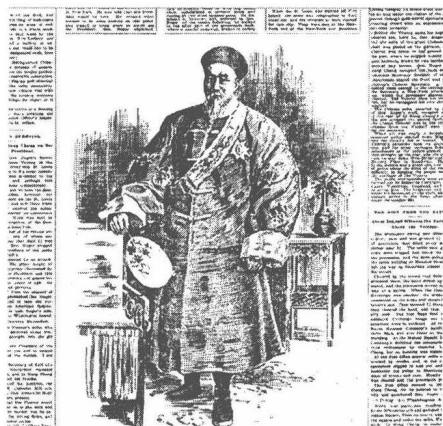
国外媒体中的李鸿章