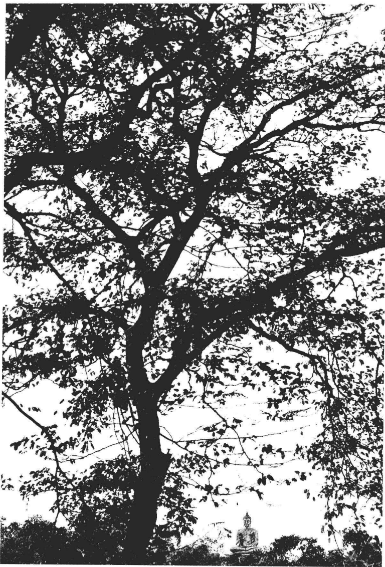
古印度拘萨罗国舍卫城 [1]