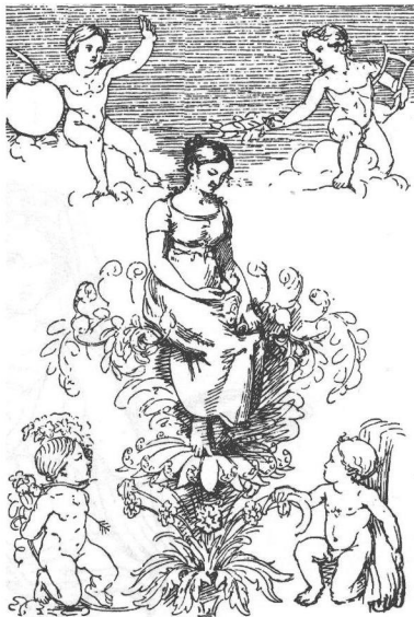
图3 《大自然》，奥地利画家龙格(Ph. O. Runge)，作于1810年。

在21世纪全球化的大背景下，选择几个侧面，用现代汉语把人生世界结构予以哲学化，即陈述世界哲学(World-Philosophy)，是我认定的一次返乡或寻家，是一次“远望可以当归”，当然也是“我有数行泪，不落十余年。今日为君尽，并洒秋风前”。