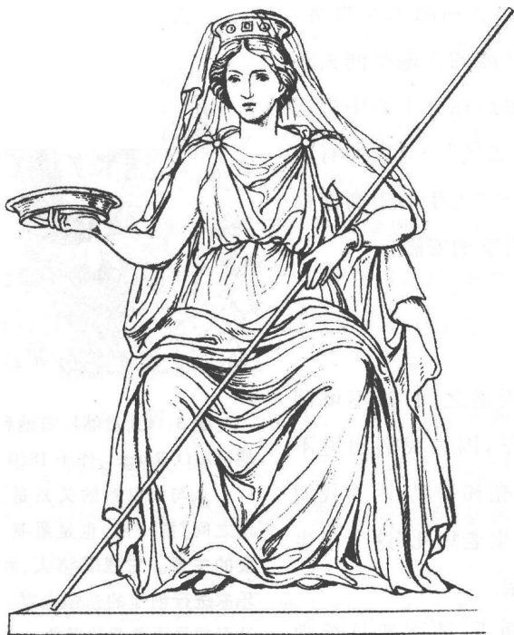
图2 莱娅 古希腊神话中的诸神之母。

古希腊民族善于创造、杜撰各种神话,把“人生于天地间”的种种困惑、疑惑和不可解的叩问统统推到神的尊前,让神话去解答,挺省事的。