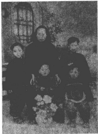
3岁的我与母亲、大哥、 二哥、三弟合影

的乡村农家，没有高深的文化，只读过小学一二年级，但颇有大家闺秀之风范。贤良方正，聪颖灵秀，中华民族女性所有的传统美德都在母亲身上体现得淋漓尽致。母亲勤劳，全家人的吃饭、穿戴，全凭她一人张罗；母亲善良，凡是遇到讨饭的上门，一定要给个囫囵馍，还要给倒碗热汤，碰见穿得单薄者，还会送件衣服，她经常教育我们要善待好人、善待穷人；母亲节俭，做饭有谱，下米有量，从不舍得丢弃一粮一饭，“家有寸槐不可烧柴”，她爱惜一物一件，衣服经常折旧翻新，再折旧再翻新，实在无价值的破衣烂袄也要洗净打成骨胚再利用，花钱开支更是算着用，一分钱都要用在刀刃上；母亲手巧，她做得一手好针线活，缝纫、裁剪、刺绣、剪纸，样样都在行，只要见个样就能摸索着做出来，中式偏襟立领琵琶扣圆摆上衣、西式齐膝百褶裙、欧式童帽、西式马裤、法式手提包等都缝制得极好；母亲刺绣，做工精细，配色艳丽，针法有创意，像鱼儿戏莲、富贵牡丹、莲生贵子、状元及第、石榴如意等都栩栩如生；剪纸更是母亲的拿手好戏，“喜鹊登梅”“大地闹春”等都剪得惟妙惟肖。谁家红白喜事，都少不了母亲，母亲总是当成自家事似的热情帮忙。母亲刺绣、剪纸等本领，我和哥哥弟弟们也学会了几招。母亲从不娇惯我们，她教育我和哥哥弟弟们从小热爱劳动，扫地、洗碗、抬水、拾麦、挖野菜、推磨磨面，等等，我们从小就乐意干。“润物细无声”，母亲的言传身教，对我和哥哥弟弟们起着潜移默化的作用，这在我们的成长过程中起到了不可估量的作用。