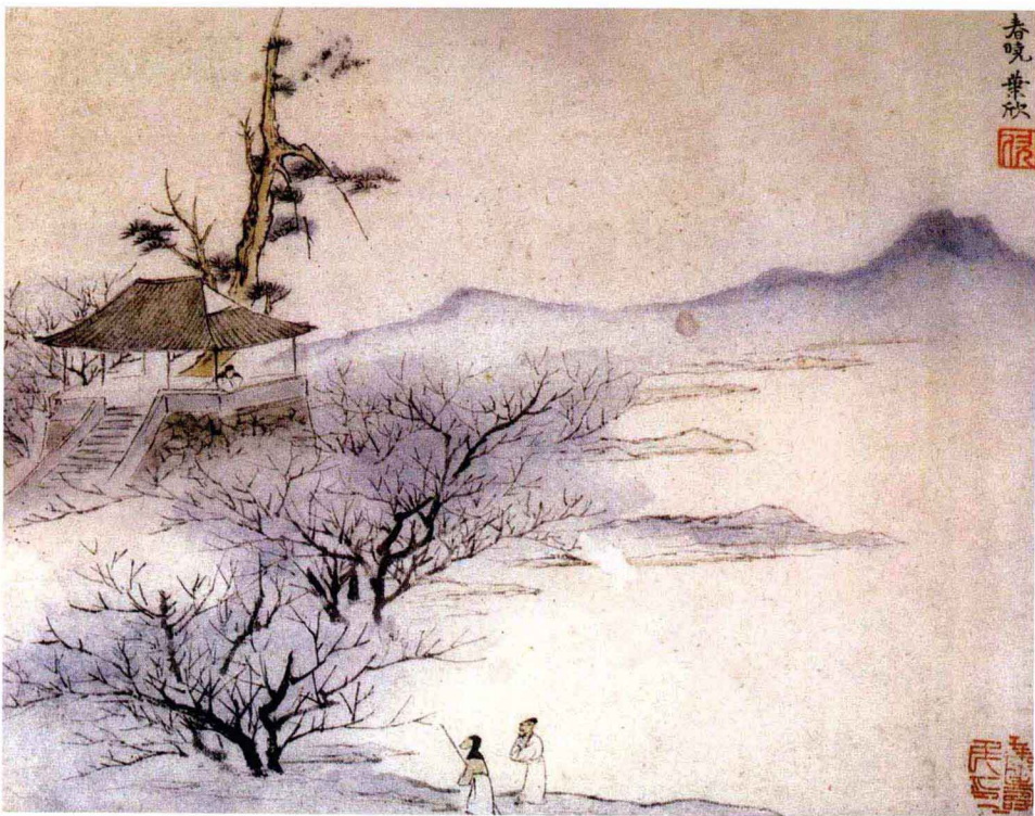
叶欣 春晓图 纸本墨笔