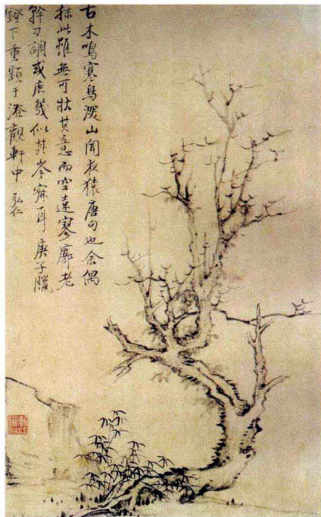
弘仁 古木竹石图 纸本墨笔

综合全年大盘指数走势来看，2004年1~5月份运行的比较平稳。从6月份展开了一波比较凌厉的上攻行情，该月大盘上涨102.63点，涨幅为9.00%，在当时来看无论是