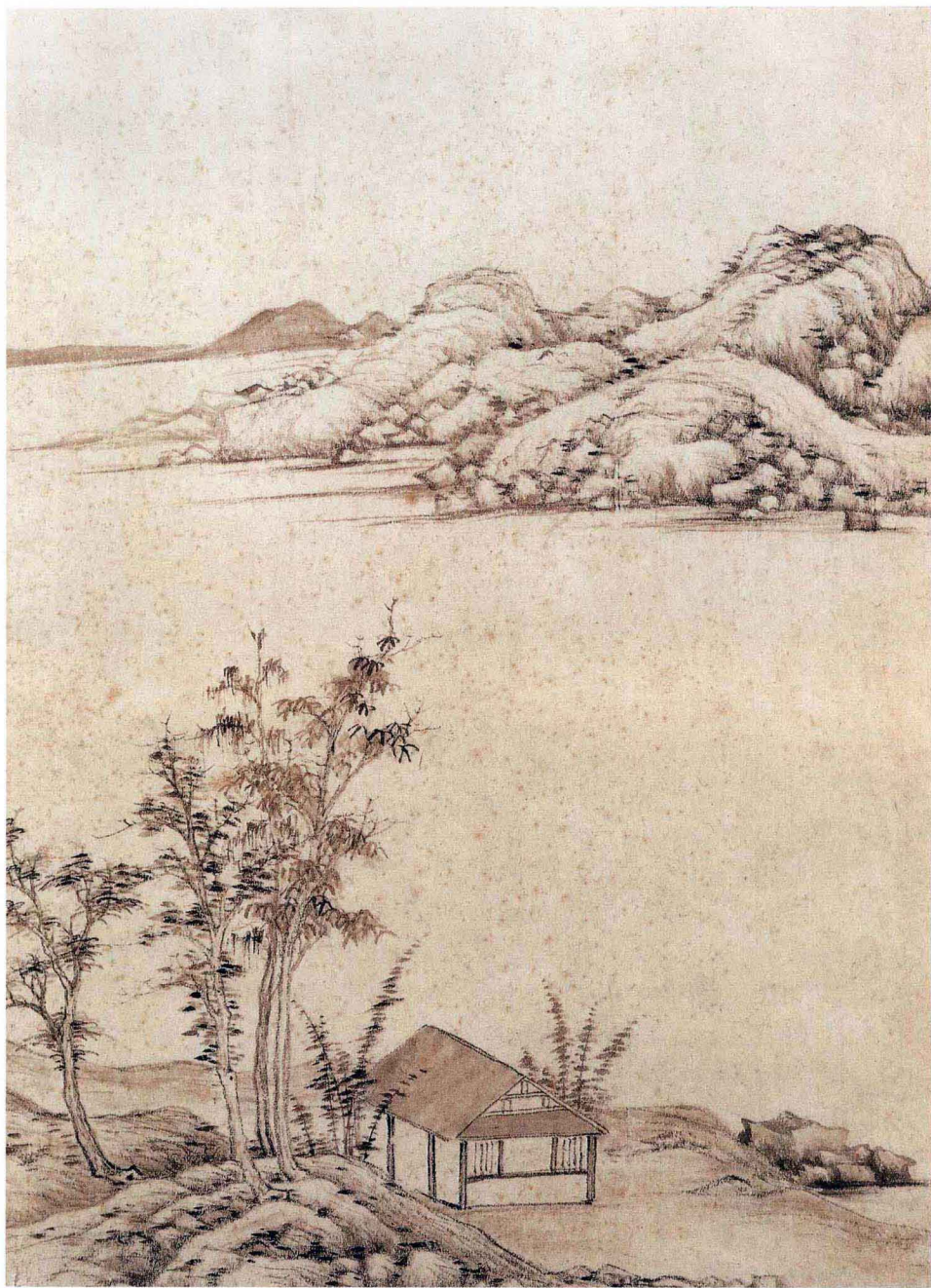
董其昌 仿云林山水 纸本墨笔