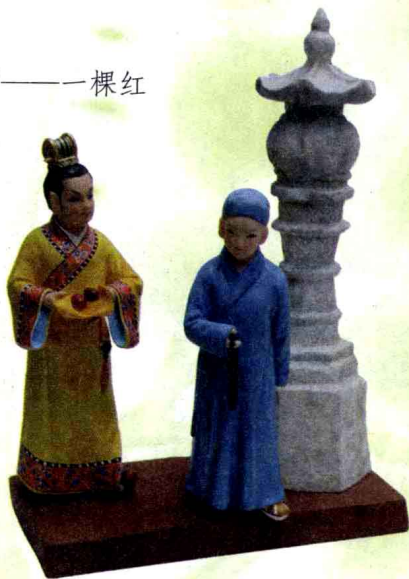
惠山泥人《红豆相思》(喻湘莲制作)

“交枝红豆雨中看，为君滴尽相思血”——一棵红豆树又哪堪这般绵延千年的幽愁与相思？