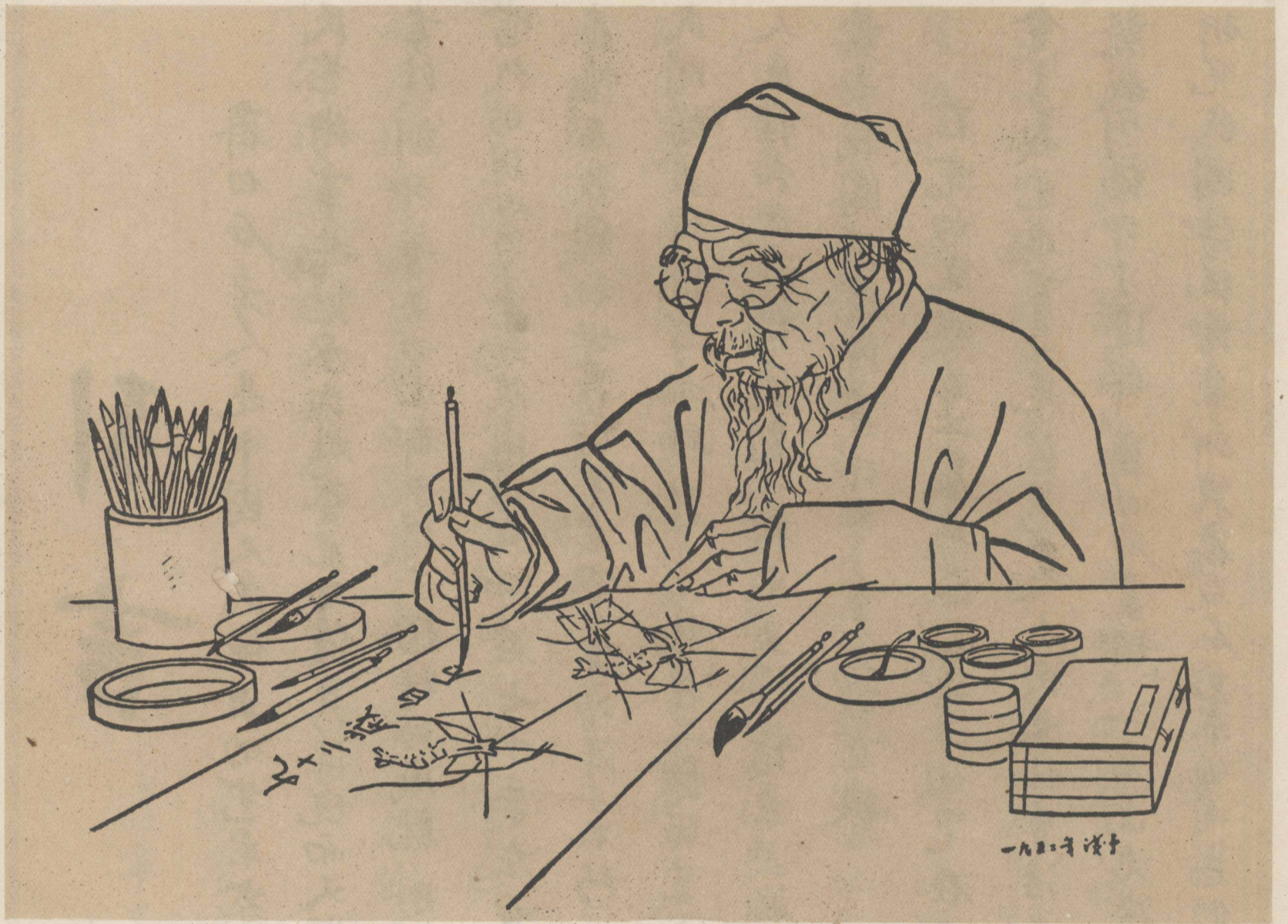
齐白石老人 叶浅予速写