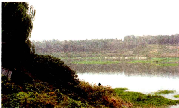
跨洹河南北两岸的殷墟古称“北蒙”，甲骨文卜辞中又称为“大邑商”“邑商”，是中国商代晚期的都城

如果对殷墟毫无了解，可以看看一个评选结果，就可知殷墟在中国考古界的地位。2001年3月，在由国内48家权威考古机构参加的“中国20世纪100项考古大发现”的评选中，殷墟以最