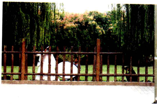
在殷墟遗址拍摄婚纱照片

殷墟景区的开阔，让我想到泰国的世界文化遗产大城。大城给我的感觉就是整洁、空旷、开阔、疏朗，令我赏心悦目，又惊叹不已。原来以为只有泰国的世界文化遗产大城是最美的，现在到安阳殷墟了，才知道中国也有同样美的世界文化遗产，两者遗产类别是一样的，景观风格也比较接近。