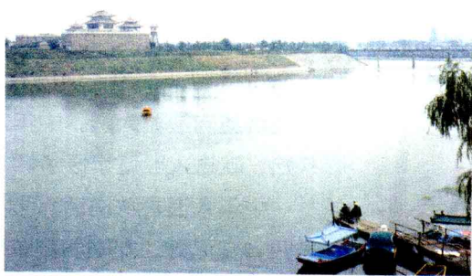
这条河就是甲骨文中已有记载的洹水