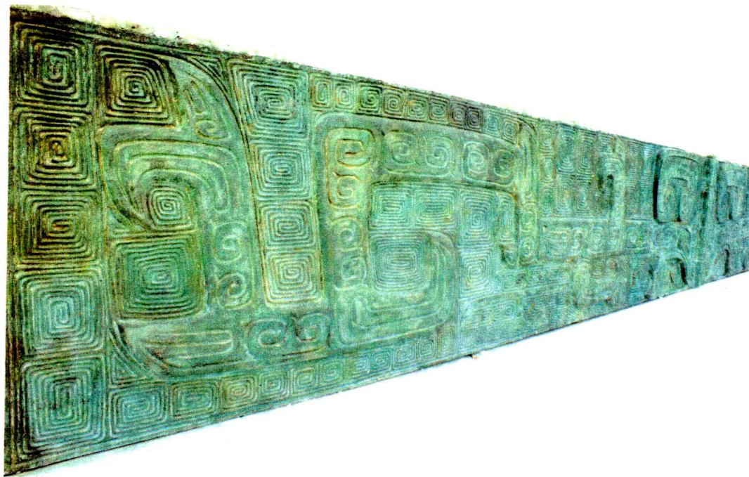
殷墟遗址出土的青铜器纹饰