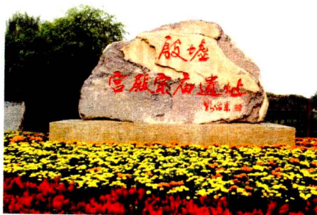
殷墟宫殿宗庙遗址