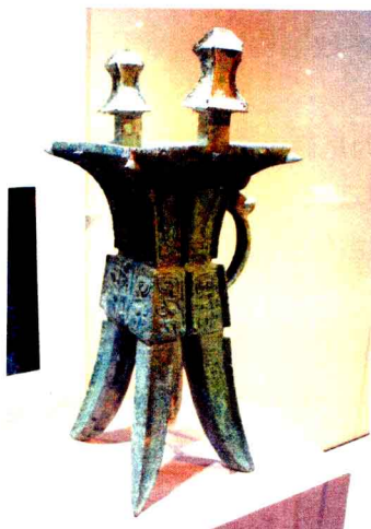
殷墟出土的青铜器方罍,被誉为“罍中之王”