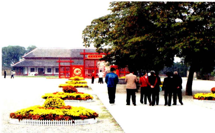
殷墟博物院·甲骨文发现地

本届世界遗产大会召开前，137 个国家和地区的 812 处遗产被列入《世界遗产名录》，其中文化遗产 628 个，自然遗产 160 个，文化和自然双重遗产 24 个。目前，中国共有 33 处文化遗址和自然景观被列入《世界遗产名录》，数量居世界第三位。