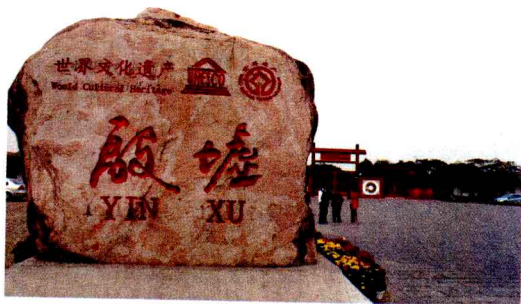
世界文化遗产殷墟