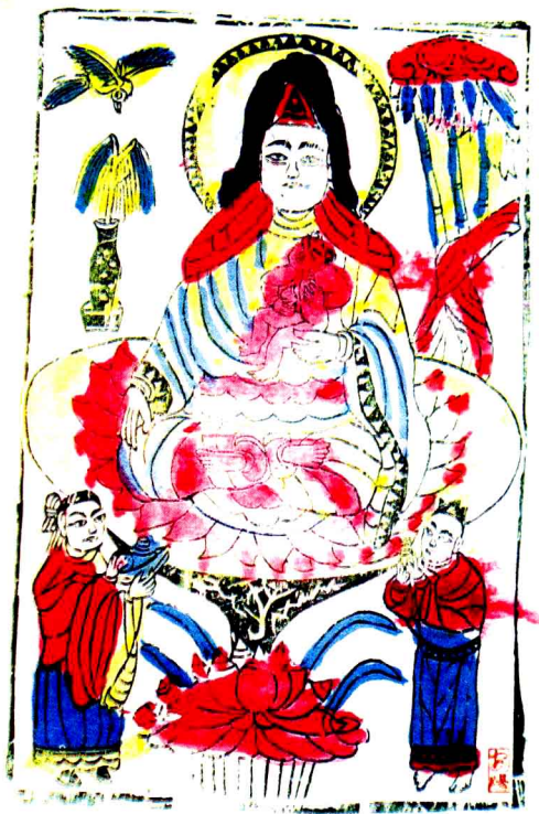
送子观音。香港木味斋主许晴野收藏的安阳年画

其中，我收藏的安阳系列火花有“为人民服务”一套十枚、“殷墟出土文物”一套十枚等大套花，还有一些套花，或表现安阳的历史文化，或表现安阳的风土人情，