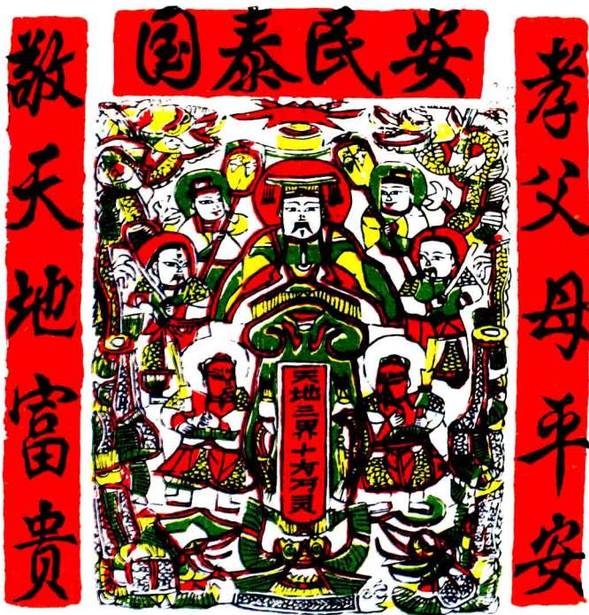
天地三界十方万灵。安阳汤阴后高汉村秦岭出品