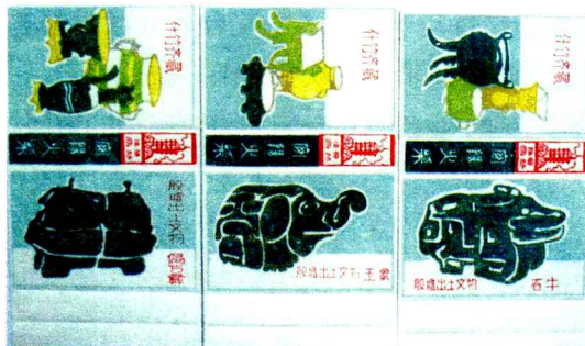
殷墟出土文物火花藏品