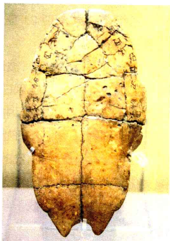
殷墟出土的甲骨文“让馘其来”全甲刻辞

殷墟遗址核心区域宫殿宗庙遗址、王陵遗址,被同时列入《世界遗产名录》,由此可见,殷墟在中国文化遗产和世界文化遗产中的崇高地位。