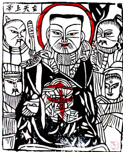
玄天上帝。安阳汤阴后高汉村秦岭出品

释说：“彰德府是安阳的古称，彰德府城隍庙什么时候建的，说不清楚，《彰德府志》有记载：彰郡有城隍庙，自设郡起，而其由来已久。《彰德府志》认为庙始建年代应早于明，此庙于公元1359年重建，明景泰五年即公元1454年，清乾隆三十七年即