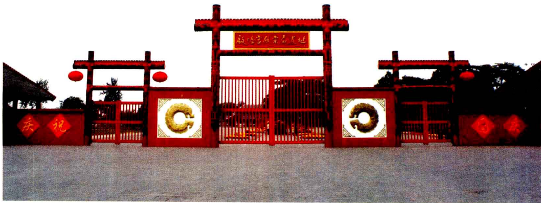
殷墟宫殿宗庙遗址大门