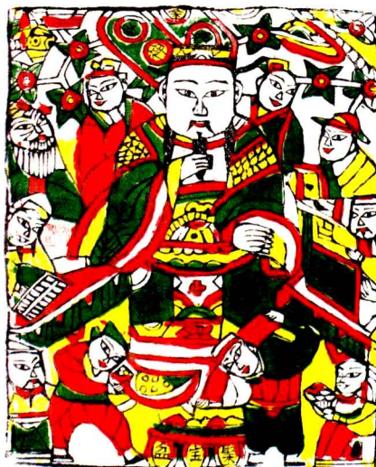
财神。安阳汤阴后高汉村秦岭出品