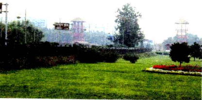
古老而年轻的安阳

“安阳是中国七大古都之一，国家历史文化名城。约公元前 1300 年，中国商代的第 20 位国王盘庚已经在此建都，至今安阳建城已有三千三百年的历史。这里不仅有包括甲骨文、青铜器和都市建设在内的殷商文化，而且还有许许多多的为人们所熟知的人文景观，如两万五千年前的原始人洞穴、上古时代的二帝王陵、周易发祥地的羑里古城、建安风骨的邺城文化、西门豹治邺的古河道、精忠报国的岳飞的故里等。”