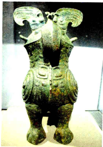
殷墟出土的青铜器鸮尊,被誉为“战神之鸟”