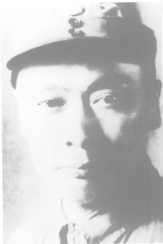
新四军代军长 陈毅 新四军军长