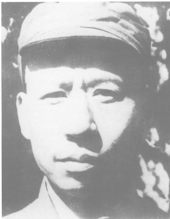
中共中央中原局、华中局书记 刘少奇 新 四 军 政 委