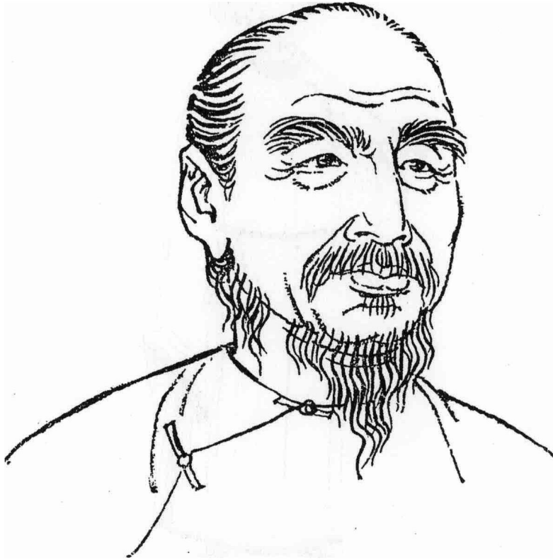
洪亮吉（公元1746~1809年） 張廣繪

註：此圖摘自金春峰《中國古代著名哲學家評傳——洪亮吉》（續編四），齊魯書社出版，西元1982年9月第一次印刷