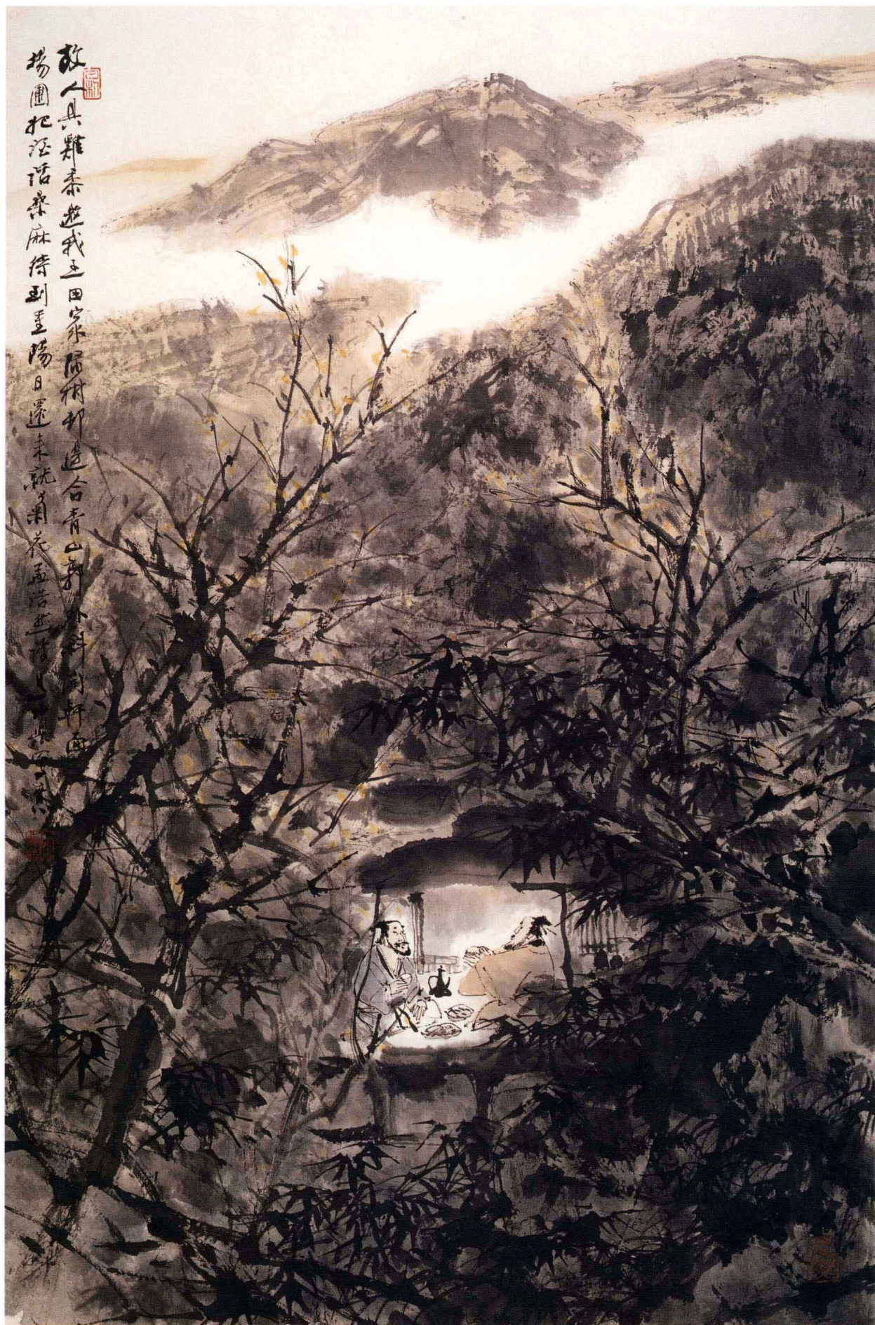
◎ 把酒话桑麻 68 × 45cm