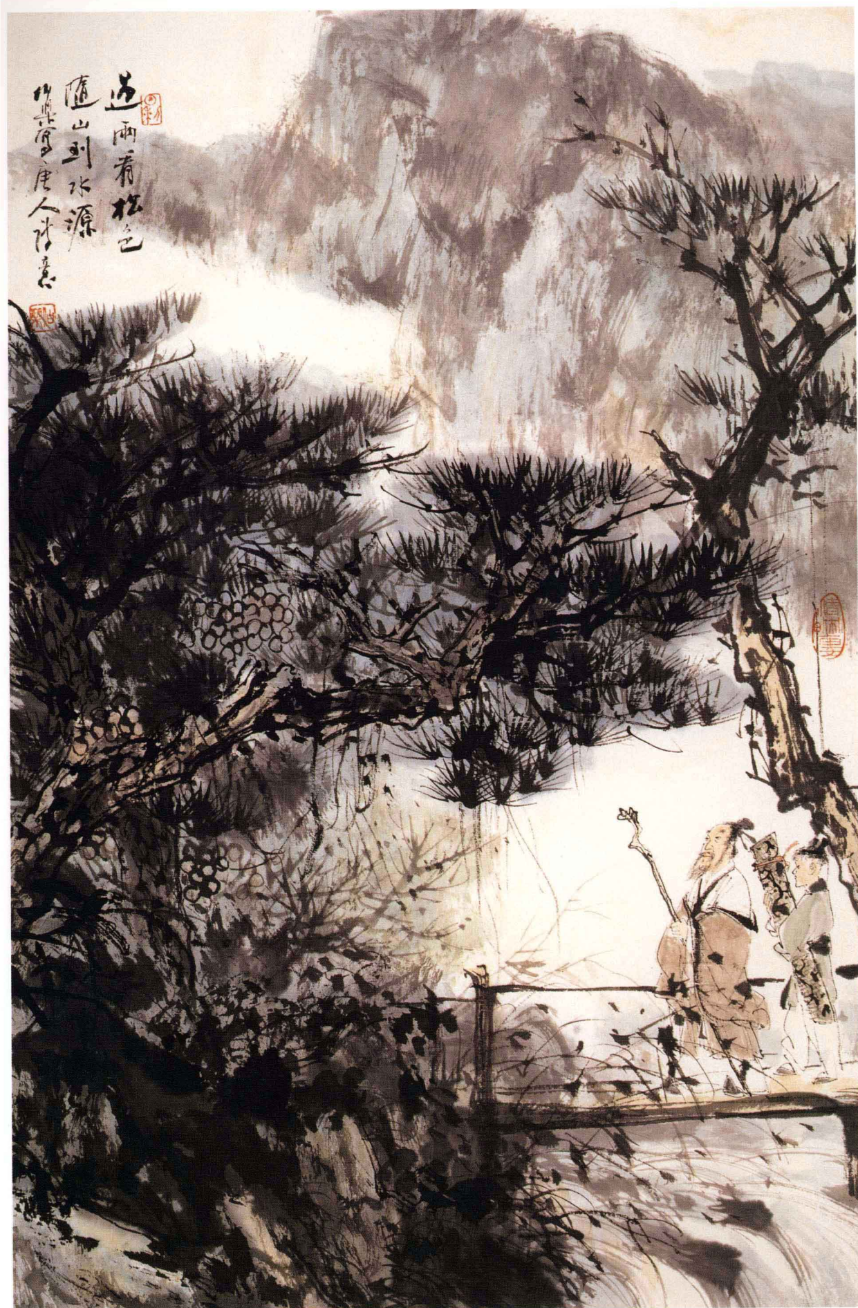
◎ 携琴访友 68 × 45cm