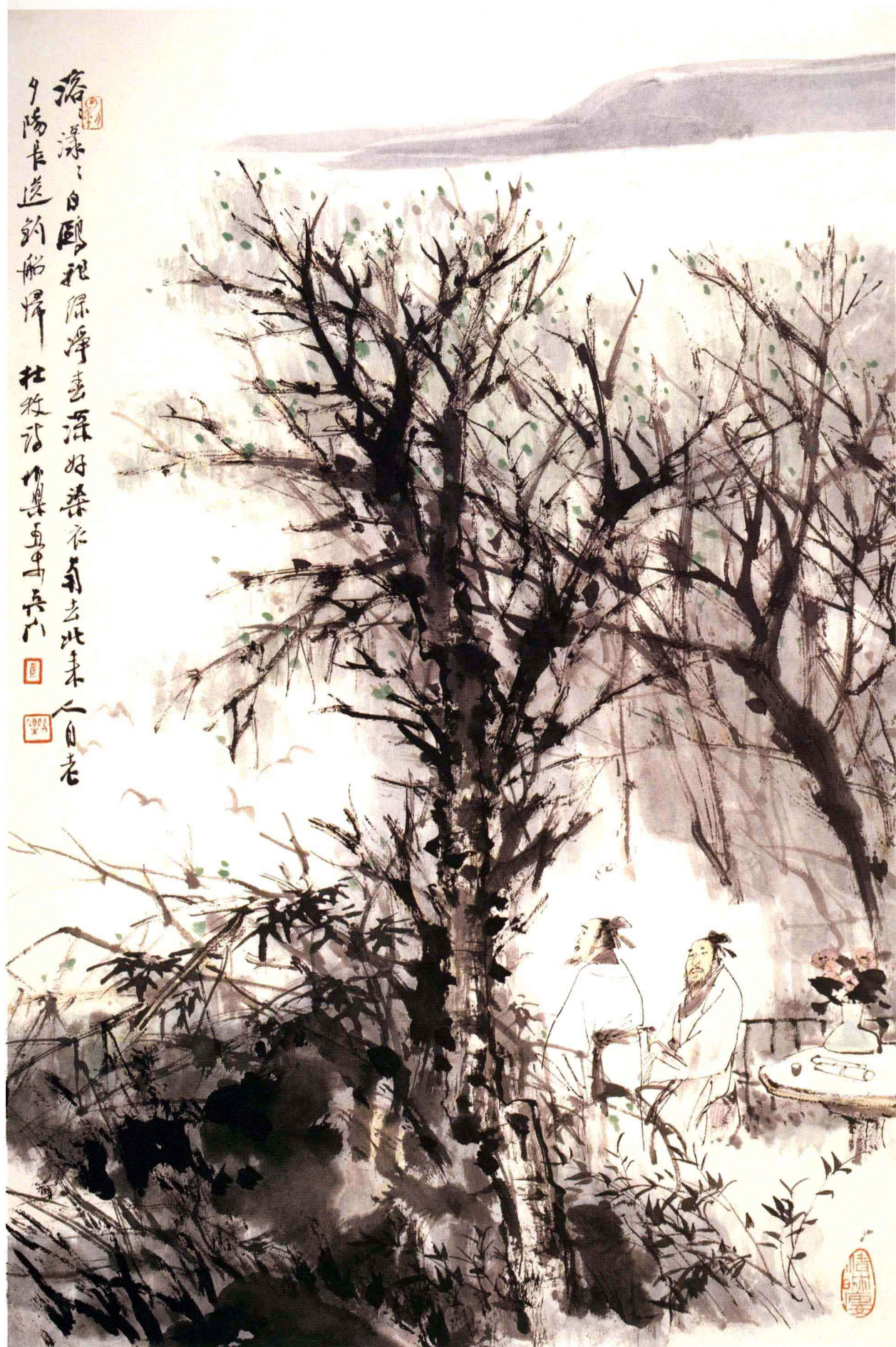
◎ 杜牧诗意 68 × 45cm