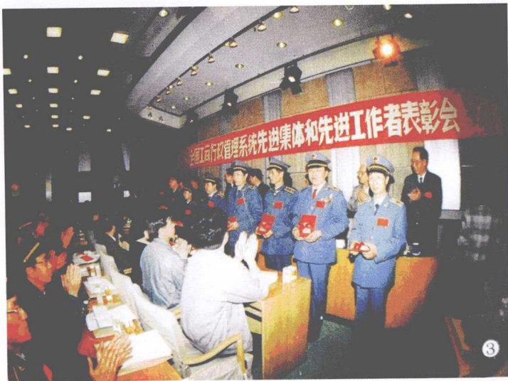
1992年作者(右2)出席全国工商系统先进表彰大会