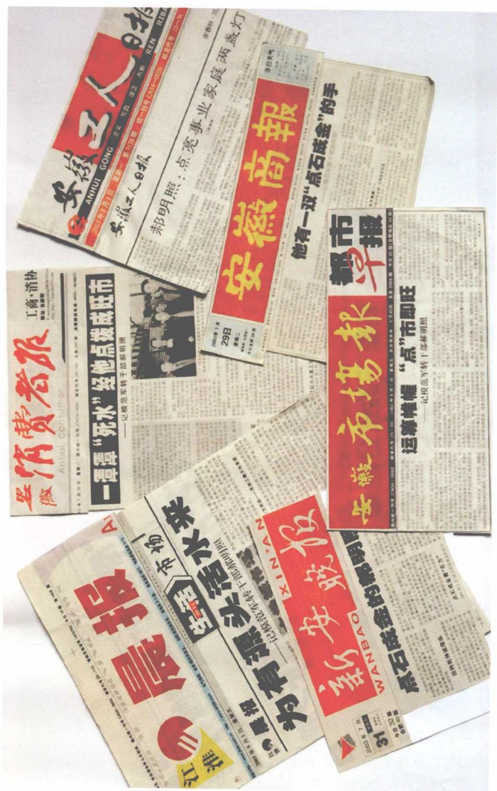
2003年八一建军节期间各大媒体对作者进行宣传报道