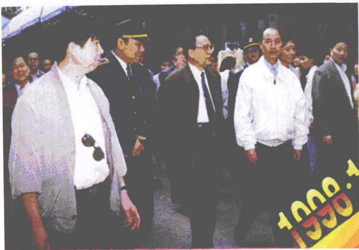
作者(左2)陪同时任中共中央政治局委员、中宣部部长丁关根(左3),安徽省委书记卢荣景(左4)视察城隍庙市场