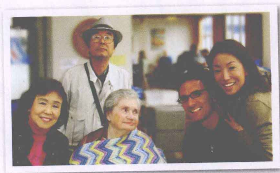
献给我的妈妈，岳母，岳父和我的爱人