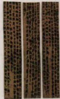
▲ 里耶秦简（上） 和马王堆汉墓帛书（右）

笔墨的发明使书写材料的选择范围扩大了，人们开始寻找更轻便、更易携带和收藏的书写材料。在中国古代，用丝织成的帛很轻便，但价格昂贵，一般人用不起；竹、木制成的简虽然重，但便于取材，所以得以长时间使用。这些简片被线连缀起来，便成为