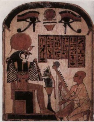
▲ 古埃及的绘彩粉刷木制华表

由于文献资料多半是人们在事后记录、整理的，往往会加入他们自己的判断和解释，通常不如实物资料可信。到19世纪，考古学逐渐发展起来，考古发现的资料成为历史研究的重要依据。