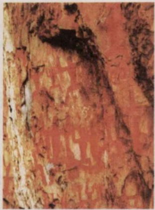
▲ 广西花山的原始壁画