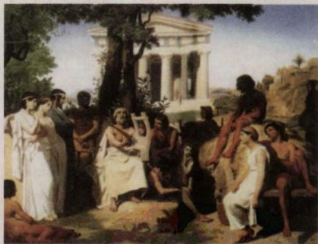
▲ 盲诗人荷马在吟唱史诗。

在许多民族的神话中，都有关于洪水的历史记忆。比如中国的大禹治水以及西南少数民族关于兄妹二人躲进葫芦从洪水中逃生的故事，还有