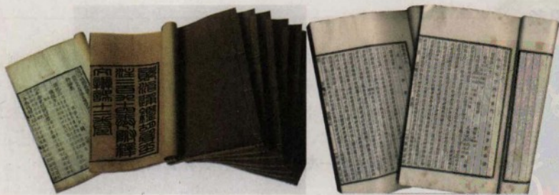
▲《新唐书》《旧唐书》《资治通鉴》书影

即使是具有良好史学道德的史家也会由于世界观、认识能力、研究方法等方面的因素，侧重记载某些自以为重要的事情，而忽略了另外一些重要的史实。比如古代史家往往注意帝王将相的活动，很少记录普通民众的生活，因为他们认为前者是重要的历史内容，而后者是前者微不足道的陪衬。