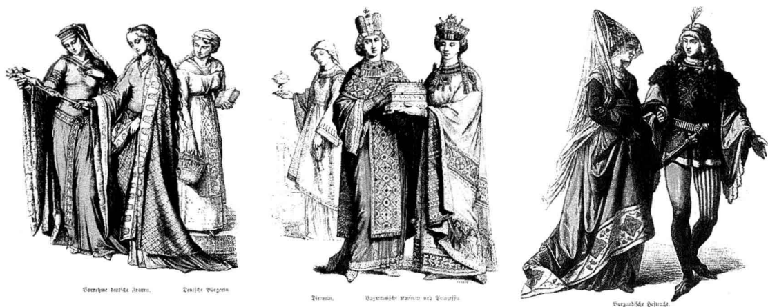
图 1-2 中世纪女装注重造型感,有一定的建筑特征。样式变得较为封闭,浓重的政教色彩赋予服装象征意义和神秘色彩。注重装饰细节和图形的表现。