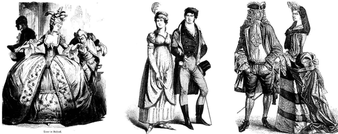
图 1-4 十八世纪至十九世纪不同阶段的文化都对同时期的女装样式和细节特征产生了重大影响,女装时而简洁自然,时而繁复雕缀,为现代女装设计提供了丰富的造型素材和细节元素。

十八至十九世纪女装文化特征指从公元十八世纪至十九世纪左右的女装发展沿革和其所表现出的文化特征。十八至十九世纪是充满动荡的资本主义全面发展时期。思想革命、政治革命、工业革命和科学革命风起云涌,浪漫主义、现实主义、印象主义、工艺美术运动等艺术思潮层出不穷。伴随着纺织业的飞速发展,此阶段女装时而简洁自然,时而繁复雕缀。巴洛克时期频繁的战事使中下层军官统治社会,奇异而奢华的风格影响女装。洛可可时期法国宫廷的安逸享乐和东方文化的影响使服装充满浮华、绮丽的特征,表现为极度强化女性特征的胸衣、帕尼耶裙撑样式(Pannier),大量新奇、精巧、柔和、纤细的装饰附庸其上。新古典主义时期审美倾向回复至古希腊古罗马时期的崇尚自然,拿破仑执政时期又在此基础上加入了泡泡袖等装饰细节并流行帝政样式。十九世纪前期受浪漫主义影响,女装回复到夸张造型的繁复样式,此时期不同阶段的文化都对同时期的女装样式和细节特征产生了重大影响并以此产生重要的变化,这些变化带来的丰富样式为现代女装设计提供了丰富的造型素材和细节元素。