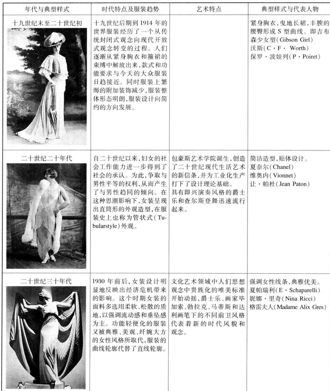
表 1-1 西方二十世纪女装发展

的回归;五十年代生活的丰裕使女装出现休闲化趋向;六十至七十年代受嬉皮朋克文化影响出现的超短裙等系列革新样式;八十年代受女权运动影响的宽肩式T型女装样式;以及九十年代后的女装样式多元化、流行大众化等。为了更好地对西方二十世纪不同时期的生活特征、经济、社会、艺术形式以及女装典型样式进行了解,特以表格的形式加以呈现。