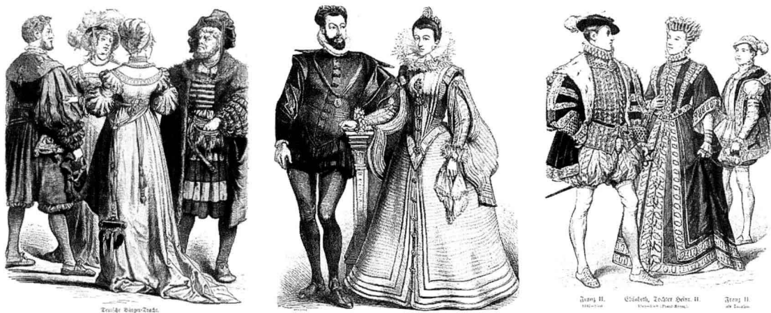
图 1-3 文艺复兴时期服装弱化人体的自然线条,通过填充、支撑物刻意夸张造型,强调装饰性效果。

文艺复兴女装文化特征指从公元十五世纪至十七世纪左右的女装发展沿革和其所表现出的文化特征。文艺复兴时期,生产力的迅速发展、资本主义萌芽的出现、文化艺术的空前繁荣,给服装带来了许多新的内容与形式。服装从中世纪的宗教禁欲向体现人体造型美和曲线美方向发展。此阶段女装注重人体线条,强调细腰与丰臀,由于采用过多的填充物(Pad)、切口(Slash)、拉夫领(Ruff)等装饰细节,女装在发展的过程中逐渐演变为过分强化人体线条、刻意夸张造型结构和极致的矫饰,女性人体变成了掩藏在服饰框架及华美繁缛装束中的躯壳。这种极致的夸张造型和丰富的装饰细节为设计带来无穷的灵感与想象,透过现代时尚,不难发现文艺复兴时期的女装对现代女装设计的渗透作用。