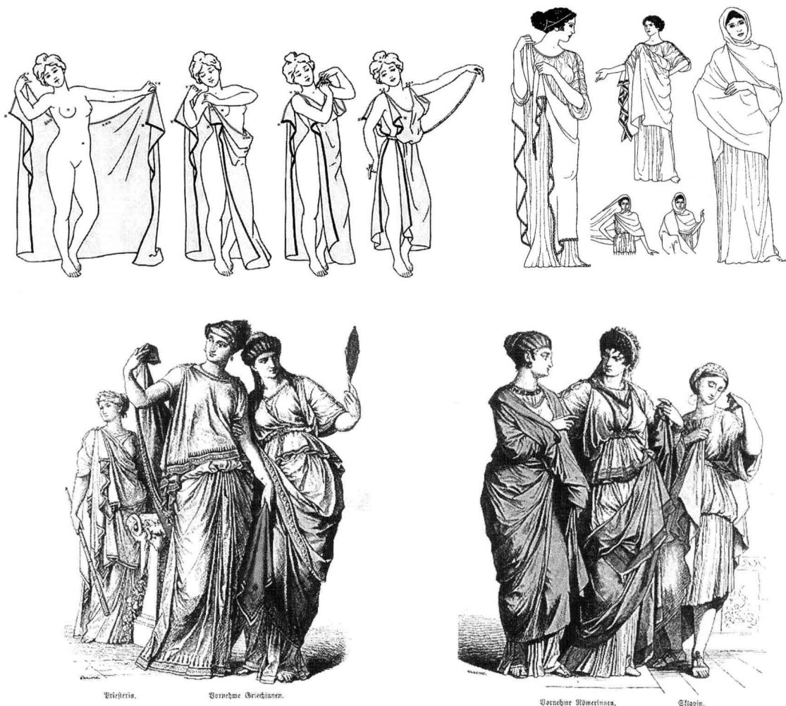
图 1-1 古希腊的希顿, 宽松自由的轮廓、缠绕的结构、流动感的线条、雕塑感的布纹效果, 充分体现女性的自然身躯。