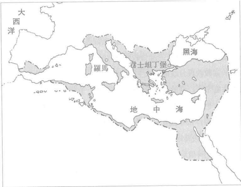
圖1 565年查士丁尼大帝時代的拜占庭帝國