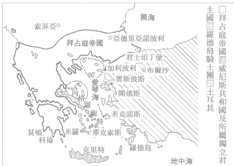
圖3 東地中海世界1340年勢力分佈圖