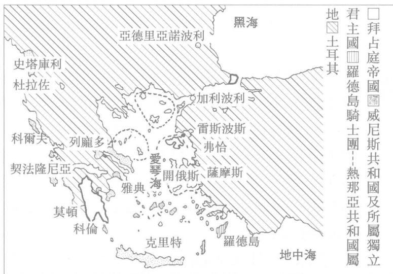
圖4 東地中海世界1402年勢力分佈圖