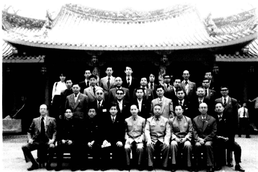
(10)1980年10月19日,参加“福州市-长崎市结成友好城市签字仪式”的代表在日本长崎市唐人馆前合影留念。