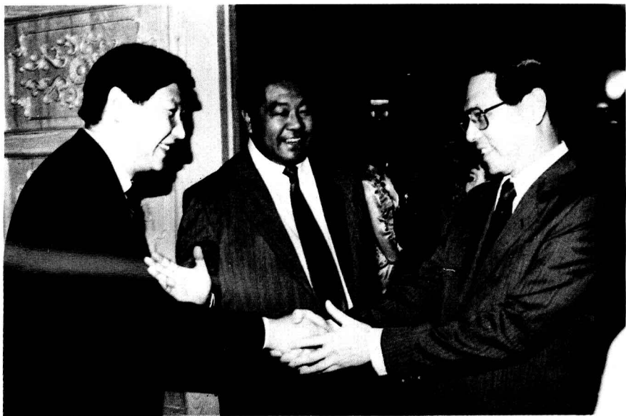
(1)1993年1月,中共福建省委书记贾庆林(中)和省委常委、福州市委书记习近平(左)会见前来访问的新加坡职工总会秘书长王鼎昌一行。