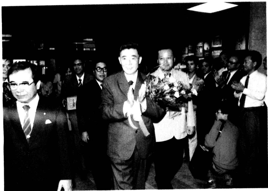
(9)1983年10月,中共福州市委书记、市人大常委会主任张继中率友好代表团访问日本长崎市,参加两市结好三周年纪念活动。