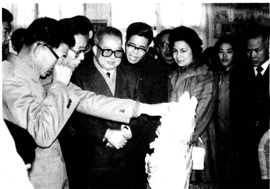
(12)1983年12月19日,柬埔寨王国西哈努克亲王和夫人在福州雕刻工艺品总厂参观。