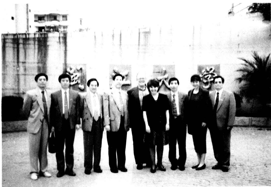
(17)1996年11月,福州市友好城市-美国塔科马市客人访问闽江大学。