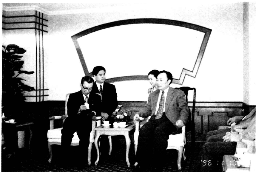
(2)1996年11月,中共福建省省委常委、福州市委书记赵学敏会见日本友人塚本幸司先生。