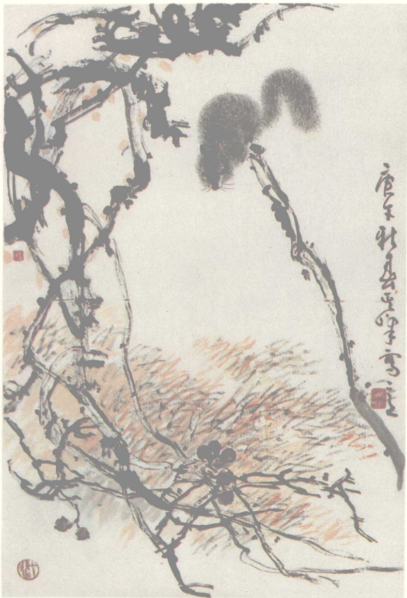
1 松 鼠