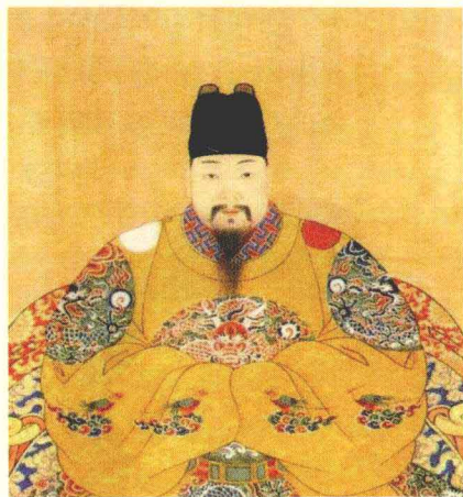
明熹宗朱由校曾亲自动手制作核雕

核雕艺人夏白眼的雕刻技艺非常奇绝，他曾在一枚乌榄核上雕刻了16个娃娃，每个娃娃的形状只有半粒米大小，可是眉毛、眼睛都清晰可辨，个个形神俱备；又如他将一枚橄榄核雕刻成一朵盛开的荷花，而荷花上面则雕刻着9只飞跑的白鹭，真可谓鬼斧神工。人们把他雕刻的作品都当做宝贝一样珍藏起来。在文章的最后，高濂还称夏白眼的作品为“一代奇绝”。