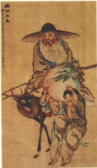
在中国民俗文化中，桃子是幸福、吉祥和长寿的象征