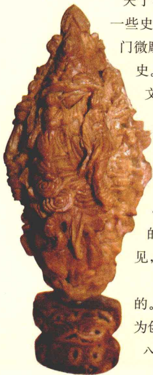
八仙摆寿 都传恭 桃核雕

我国民间最早的核雕作品，大都是以桃核雕刻而成的。在众多果核当中，艺人们为什么首先选择以桃核作为创作的材料呢？