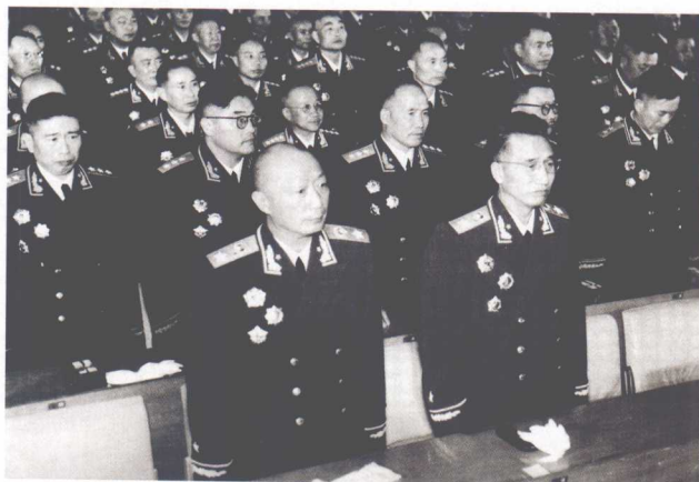
▲ 授衔仪式上的部分元帅和将军。

▼ 全国人大常委会第二十二次会议通过《关于授予中华人民共和国元帅军衔的决议》。（历史资料）