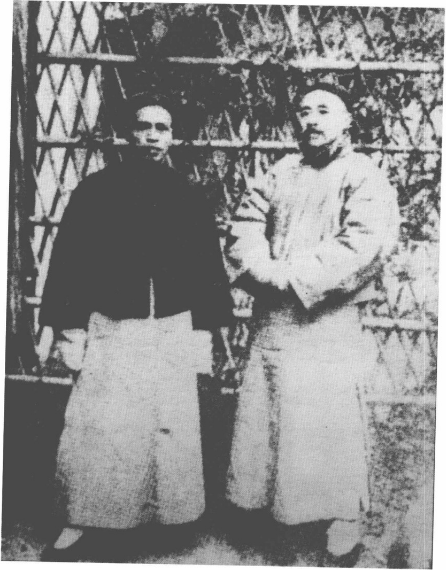
一九一六年王國維在日本京都淨土寺町永慕園與羅振玉合影。