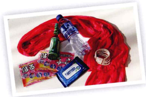
▲这些小物品，可以帮助你轻松应付拍摄现场的各种紧急状况。