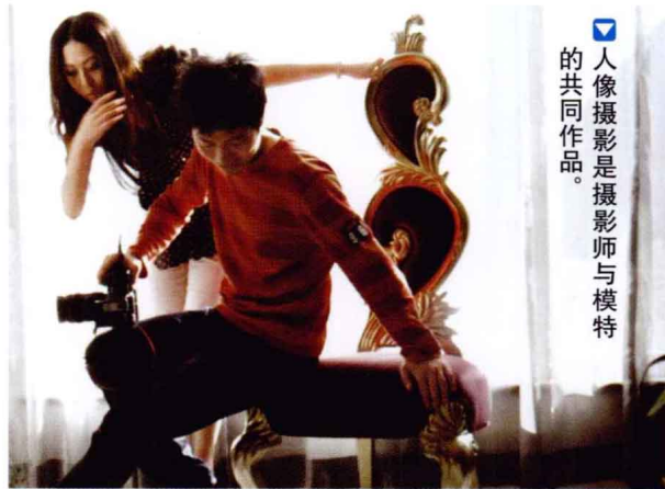
人像摄影是摄影师与模特的共同作品。

要知道，人像摄影是摄影师与模特的共同作品，要拍摄一张成功的人像照片却不是想象中那么简单，它的关键在于被拍摄模特的“神形兼备”。另外，如果摄影师和模特之间属于初次合作或者是商业伙伴关系，还需要摄影师和模特进行提前沟通，互相熟悉，让模特更快地进入“表演”状态，才能拍摄出让大家都比较满意的作品。