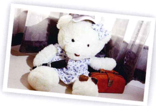
▲这些小道具，可以帮助你轻松摆出神奇的好POSE。

小物品是否也已经在你的装备箱里了。它们可以帮助你轻松应付拍摄现场的各种紧急状况。