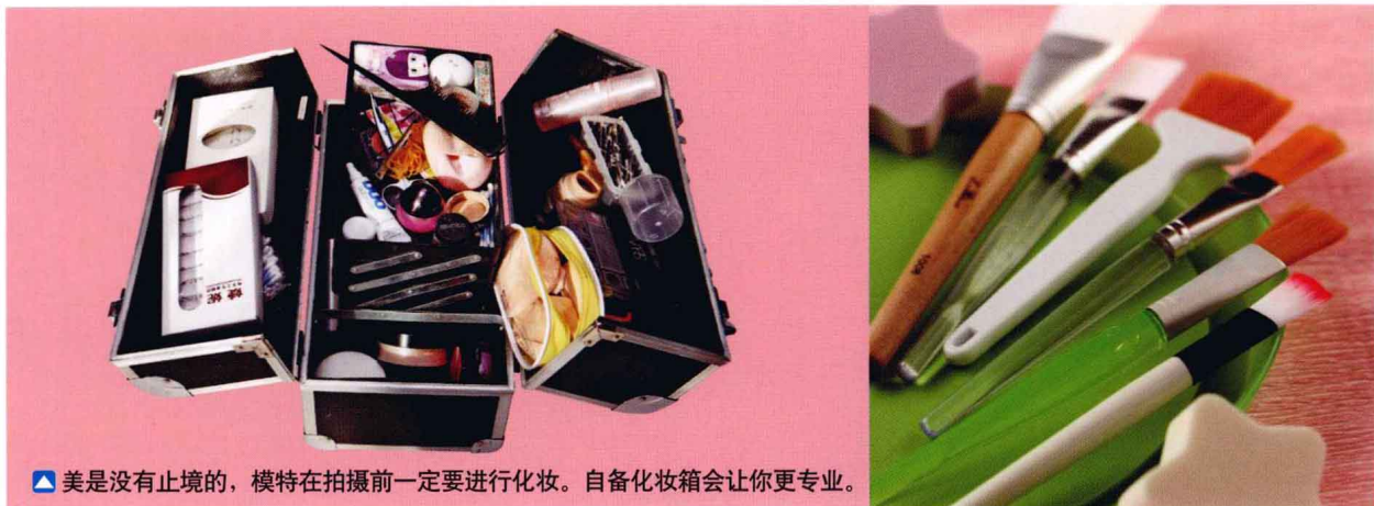
▲美是没有止境的，模特在拍摄前一定要进行化妆。自备化妆箱会让你更专业。