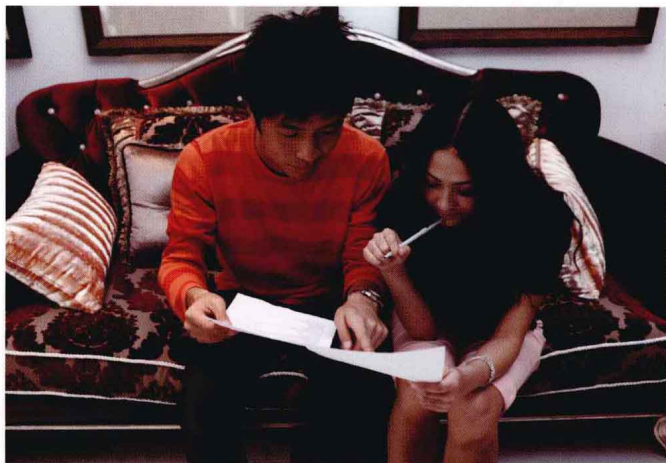
与模特签订法律文本可以避免一些不必要的纠纷。

对于摄影作品而言，主要存在着两项基本权利，即著作权和肖像权。为了避免一些不必要的纠纷，摄影师首先应该完善必要的法律文本，在拍摄之前和模特进行充分地沟通，详细地和模特说明照片的用途，并与模特签订相关的法律文本。