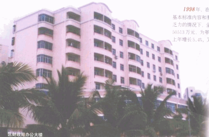
区财政局办公大楼

该局的主要工作经验是：1、领导重视，特别是第一把手亲自来抓，措施得力，干部职工齐心协力，是搞好工作的基础。2、创建工作必须与财政工作有机地结合起来，创建现代文明机关的最终目的才能达到。3、创建现代文明机关，人的因素是关键，抓好干部队伍建设才能促进机关工作的全面发展。4、财政收支管理工作要抓早、抓实、要动真格，一抓到底，决不放松。