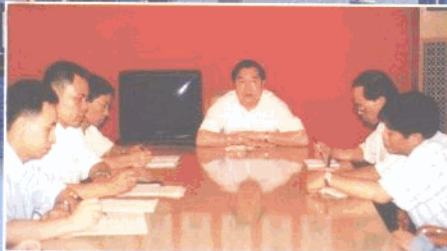
副市长兼发展 计划局局长黄行光 在部署工作。