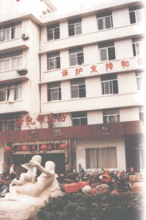
海口市妇幼保健院一角