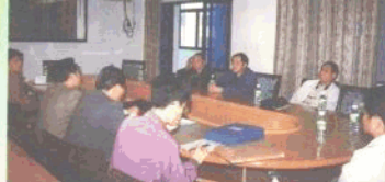
市、区领导与有关部门人员一起研究农村改厕工作。