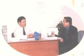
出入境管理科同志热情为公务访人员解答问题