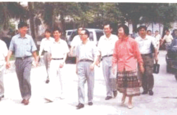
省委副书记、市委书记蔡长松等领导视察海南华侨中学