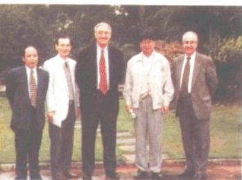
美国戴克拉荷马市大学代理校长(中)和 校长助理(右一)考察我校与有关领导合影