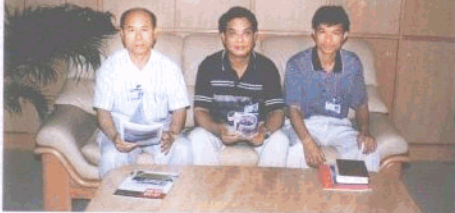
团结奋进的区财政局领导班子