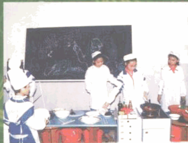
开展学生做主人活动。