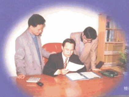
精诚团结的领导班子

本所始终坚持以“质量求生存，以信誉求发展”以服务宗旨，竭诚为社会各界提供以下服务：帐表审计、专项审计、基建审计、资产评估、土地评估资本验证、代理记账、财务顾问、税务代理、策划及经批准的其它事项。