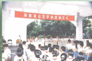
海南省示范学校授牌仪式在市二十七小学举行。