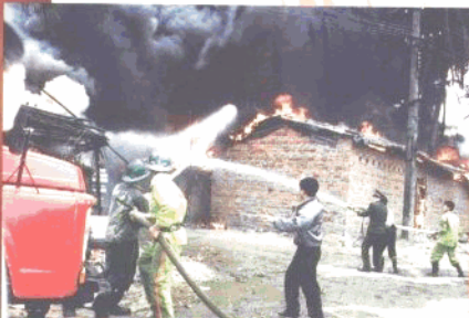
119 迅速出击扑灭大火

五、进行电焊、气焊等具有火灾危险的作业的人员和自动消防系统的操作人员，必须持证上岗，并严格遵守消防安全操作规程。