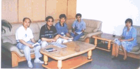
局党员干部在一起学习财政法规知识