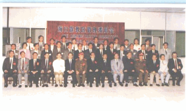
1993年4月13日，江泽民总书记参加海口保税区封关典礼时，接见海口市四套班子成员。

投资4.16亿元人民币，被国家经贸委列为国家高科技重点推广项目的海口保税区模糊控制器技术生产基地，现已形成了一定生产规模。图为已建成投产的模糊控制器生产线。