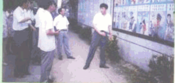
市委副书记符兴、副市长吴耀法在健康教育工作。