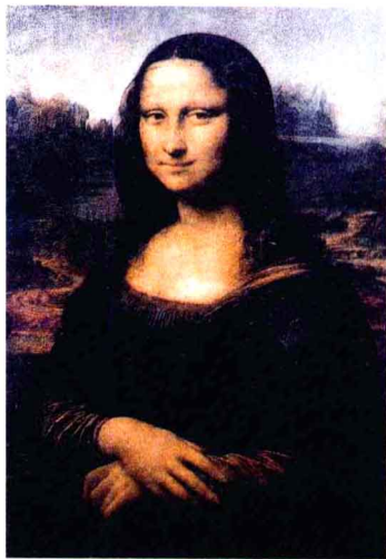
>《蒙娜丽莎》油画。高77厘米，宽53厘米，意大利画家莱奥纳多·达·芬奇作。《蒙娜丽莎》是达·芬奇从1503年开始动笔描绘的一幅肖像作品。这幅画最初在枫丹白露展出，后来移到凡尔赛宫，最后一站就是保存至今的卢浮宫。

接下来向大家介绍的则是同样声名远驰的大英博物馆，那么，大家是否知道，大英博物馆的门票是多少钱呢？