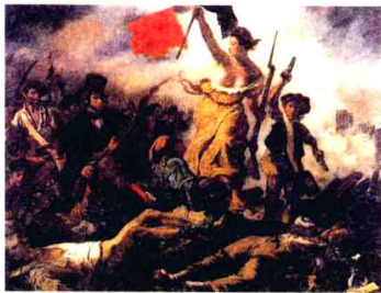
《引导民众的自由女神》油画。260厘米，宽325厘米，法国画家欧仁·德拉克洛瓦作。此画又名《1830年7月27日》，取材于1830年法国革命。