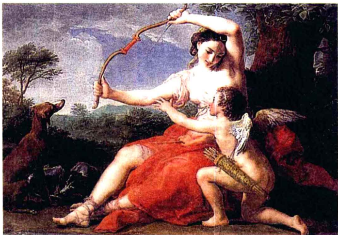
> 《戴安娜与朱比特》 油画。 高124.5厘米，宽172.7厘米， 意大利画家巴东尼作。

林梅村：“那就太多了，尤其是当年敦煌王道士卖出去的那批东西。他曾把敦煌宝物、文书，还有绢画等卖给法国的伯希和，卖给斯坦因，还卖了一些给俄国人。其中有一件文书甚至被五马分尸，一片在英国，一片在俄国。因为古董商为了多卖钱，就把文书撕开，等于一件可以卖两件的钱。所以我们现在要研究起来很麻烦，要研究一件文书实际上也要了解其他博物馆收藏的东西。”