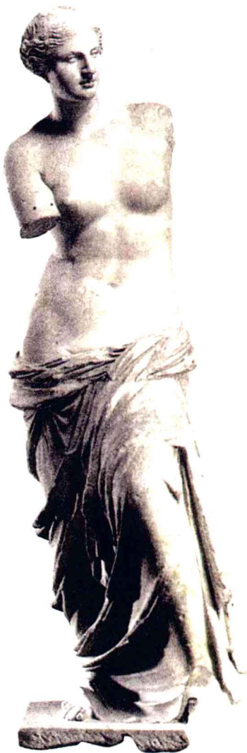
> 断臂的维纳斯 希腊化时期的大理石雕像，高204厘米，卢浮宫镇馆之宝。维纳斯是罗马神话中的爱与美神。此雕像从被发现的第一天起，就被公认为是迄今为止希腊女性雕像中最美的一尊。