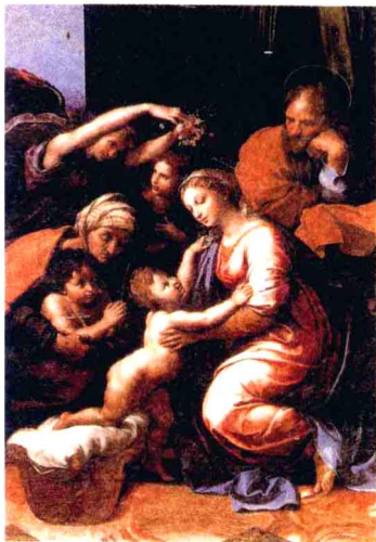
《法兰西斯一世的圣家族》油画。高207厘米，宽140厘米，意大利画家拉斐尔·圣齐奥作。拉斐尔是意大利文艺复兴三杰之一。