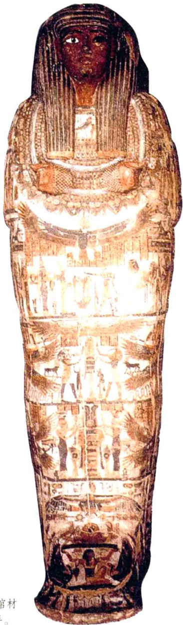
＞ 彩绘木棺 这具彩绘棺材是为霍拉维希普（一个祭司）而做的。棺材做成霍拉维希普的形象，上面的彩绘以红褐色来表现他的面部和双手。

李零：“肯定得因人而异。像大英博物馆，我当时主要的兴趣是那个亚述厅里的东西。亚述厅放置有关战争的壁画，我当时主要就是一件一件地看雕刻出的那些战争场面。西方有一些学者曾经管亚述叫做第一帝国主义，就是历史上最穷兵黩武和残忍扩张的大帝国，那个时候就是亚述帝国，即现在的伊拉克，当时帝国的宫殿则是在摩苏尔。除了看壁画浮雕之外，还看那些实物，就是那些战争场面上用到的武器。比如说他们用投石器攻城，投出的那些石弹就有网球这般大。他们攻城时的那些台阶是用土堆起来的，人可以贴着墙往上爬，台阶样子就和北京佛香阁上面的台阶一模一样，如今全都被发掘出来了。有一部电影叫《亚历山大》，那部电影里面展示的巴比伦塔的背景就是摄制组模拟做成的。最初，当欧洲的考古学家、探险学家到伊拉克考古的时候，他们根本就不能相信，这个曾经是《圣经》和古典作家笔下辉