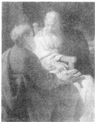
伦勃朗：两位哲学家(1628年)

一般地说，人在世界中，要吃、穿、住、行，要不断地进行创造和发展，这样必然会出现某种存在方式，与世界发生各种关系。人可以用各种方式达到对自身存在方式及其与世界关系的把握，例如常识、神话、宗教、艺术、科学和哲学等。以不同方式认识和把握到的世界，就形成对人来说不同意义的世界，如“常识世界”、“神话世界”、“宗教世界”、“艺术世界”、“科学世界”、“哲学世界”等。但是，正因为哲学把握的基本方式是反思，哲学才表现出自己特殊的特征，才与其他把握方式相区别。弄清这一点，我们就会消除对哲学的莫名畏惧而亲近它，就会觉得哲学并非让人“越学越糊涂”而是需要辩证思考，并非那么抽象玄奥而是具体深刻，也会充分认识到哲学具有独特的价值和魅力。