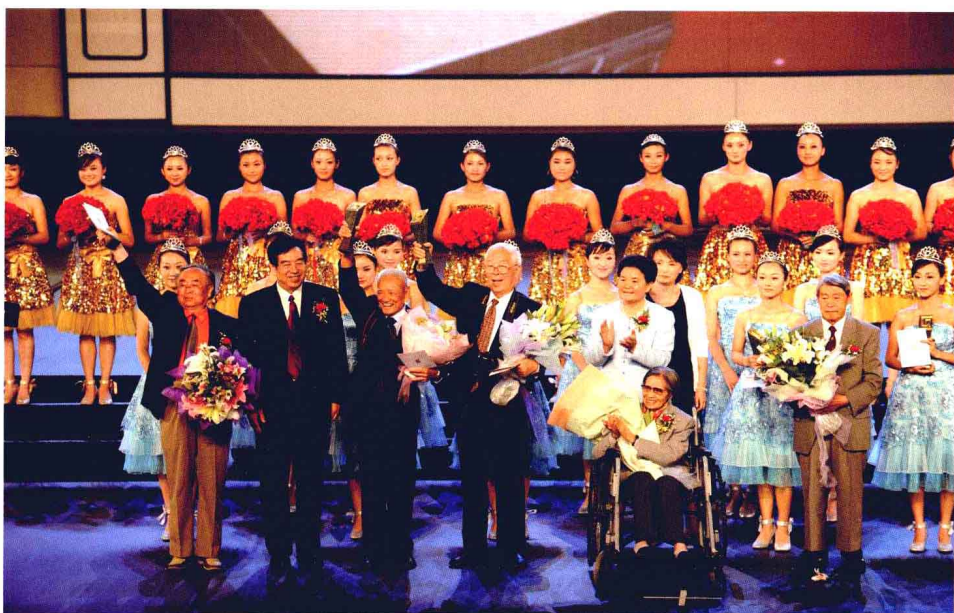
全国政协副主席李蒙（前排左二）与云南省人大常委会副主任晏友琼（前排左五）一起向到场的5位终身成就奖获得者颁奖。

本届金像奖有322位来自全国各地及旅居海外的摄影界人士申请参评，参评人数等多项指标均创下历史新高，作品风格更显多样；年轻摄影人获奖比例明显提升；拍摄表现抗震救灾、抗击冰雪灾害和北京奥运会等精彩作品的摄影家获得肯定。