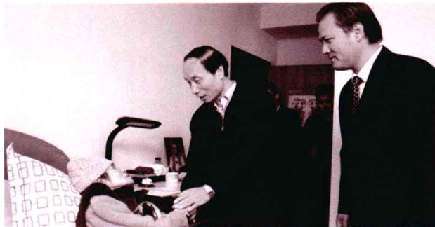
左图 乐观的徐老。 右图 中宣部副部长翟卫华在中国摄协分党组书记、副主席兼秘书长李前光的陪同下来到徐肖冰家中，首先转达了刘云山部长对徐肖冰逝世的沉痛哀悼。同时看望徐肖冰夫人、著名女摄影家侯波并对其家人表示亲切慰问。