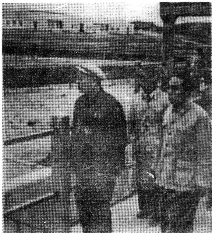
原中共中央中南 局 书记处书记、广东省省长陈郁(左一)到鹤地水库视察