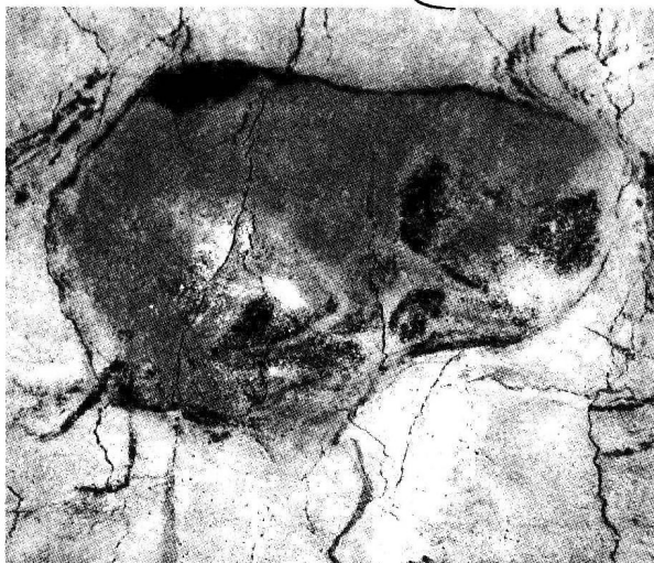
阿尔塔米拉洞窟壁画《受伤的野牛》

原始绘画多发现于洞穴的岩壁上，题材以动物为主，所画动物神态栩栩如生，反映出原始人对动物的形态和习性十分熟悉。原始绘画的风格也经历了由简到繁的过程，从较早的单色画发展为具有明暗色调的单色画和彩画。撒哈拉沙漠中部的岩画，是非洲最古老的绘画，所绘题材多为象和水牛。中国新石器时代仰韶文化的彩陶已显示出高度的造型和绘画艺术水平。