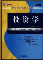
作者：滋维·博迪 (Zvi Bodie) ISBN: 978-7-111-27013-3 定价：108.00元