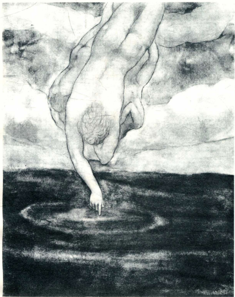
纪伯伦自绘作品插图