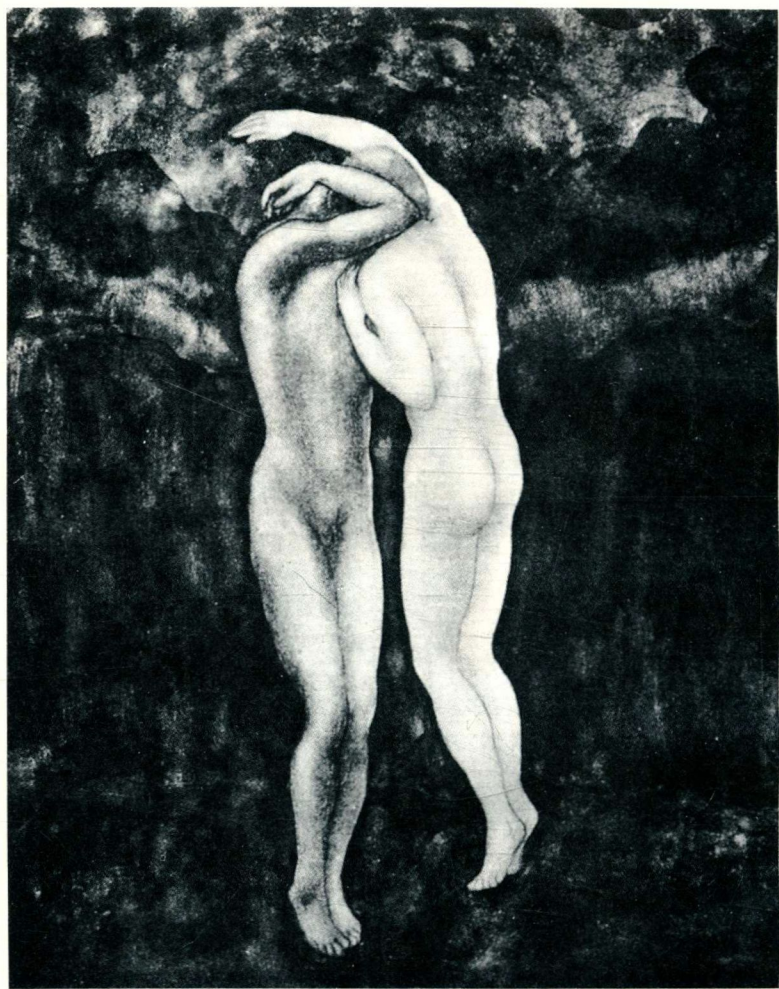
纪伯伦自绘作品插图