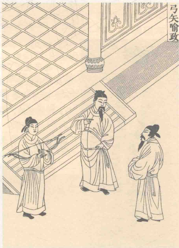
明焦竑著《养正图解》中的插图《弓矢喻政》，讲述唐太宗严于律己、善于纳谏的故事

夜班，以便向他们询问百姓疾苦和地方上发生的事，同时听取臣下的进谏（jiàn），以及时纠正工作中的失误。由于唐太宗严于律己，善于纳谏，使得当时的绝大多数官员都为政清廉、办事认真，从而开创了我国历史上的太平盛世。