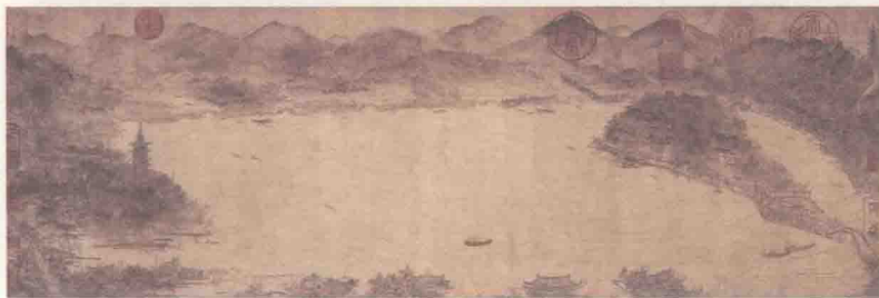
南宋李嵩绘《西湖图卷》

疏浚工程完成后，苏轼命人用挖出的淤泥在西湖中筑成一道长堤，并造了六座拱桥。堤岸种植杨柳，柳树之间又夹种桃树。从此，西湖变为人间美景。人们为了纪念苏轼的功劳，将长堤命名为“苏堤”。