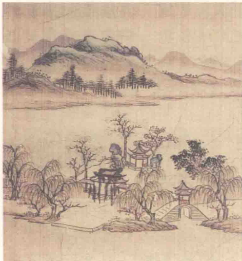
清钱惟城绘《西湖三十二景图》之《苏堤春晓》

发生旱灾，农民歉收，急需救济。苏轼便将清理西湖淤泥、疏浚（jùn）河道与救济灾民联系在一起，以工代赈（zhèn），利用冬季农闲时节，征调城郊农民疏浚河道、挖掘西湖淤泥，以