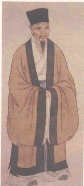
清叶衍兰绘苏轼画像