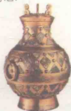
西汉乳钉纹青铜壶