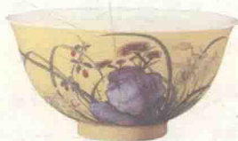
清雍正珐琅彩黄地芝兰寿石碗