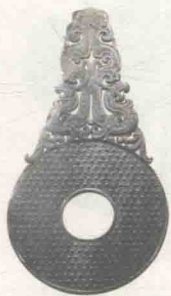
西汉玉透雕双龙纹璧