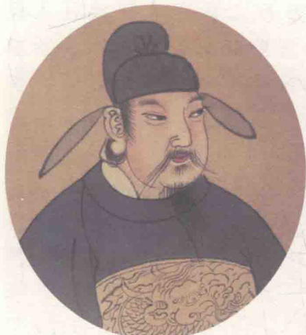
明人绘唐玄宗画像