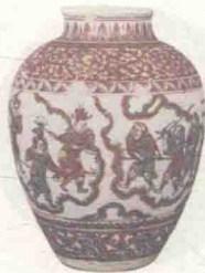
明嘉靖五彩西游记故事图罐