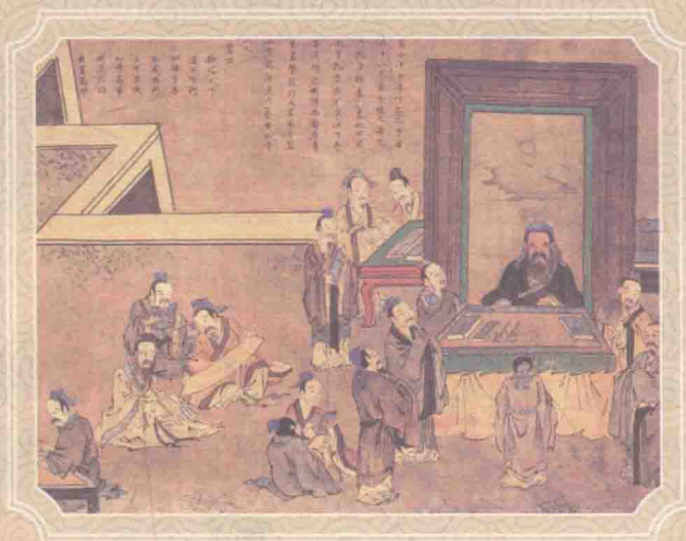
明佚名绘《孔子圣迹图》之《删述六经》