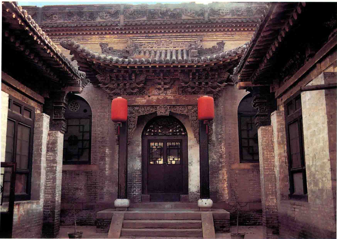
图1-3 山西祁县乔家大院 窄院两侧厢房台基低矮，而正房台基显著增高。凸起的平台、踏跺，与歇山顶的华丽门楼组合在一起，强调出正房的主体身份。