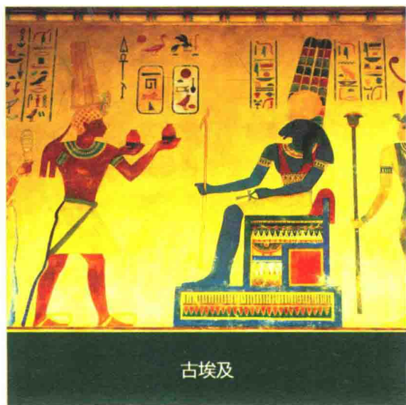
图 1-2-1 古埃及关于应用香料的记载

公元前3000年，古埃及人发明了简易的蒸馏机，从草本植物、水果、蔬菜、禾木草类及花朵等植物中提取天然香料，应用于治病、祭神以及制造木乃伊的防腐剂。1922年，考古学家在胡夫法老建造的“大金字塔”中，发现大量的化妆品、药品、按摩膏，另外考古学家还发现一些压榨或蒸馏木头、植物的器具。在1300多年前的花岗岩石板上记载着，法老王以香膏献祭狮身神，制作香膏的祭司们算得上是最早的调香师了。埃及的古书中记载埃及艳后在沐浴时喜欢加入玫瑰精油和檀香精油及橙花精油等，她巧妙地将天然香料用于自身，使自己散发