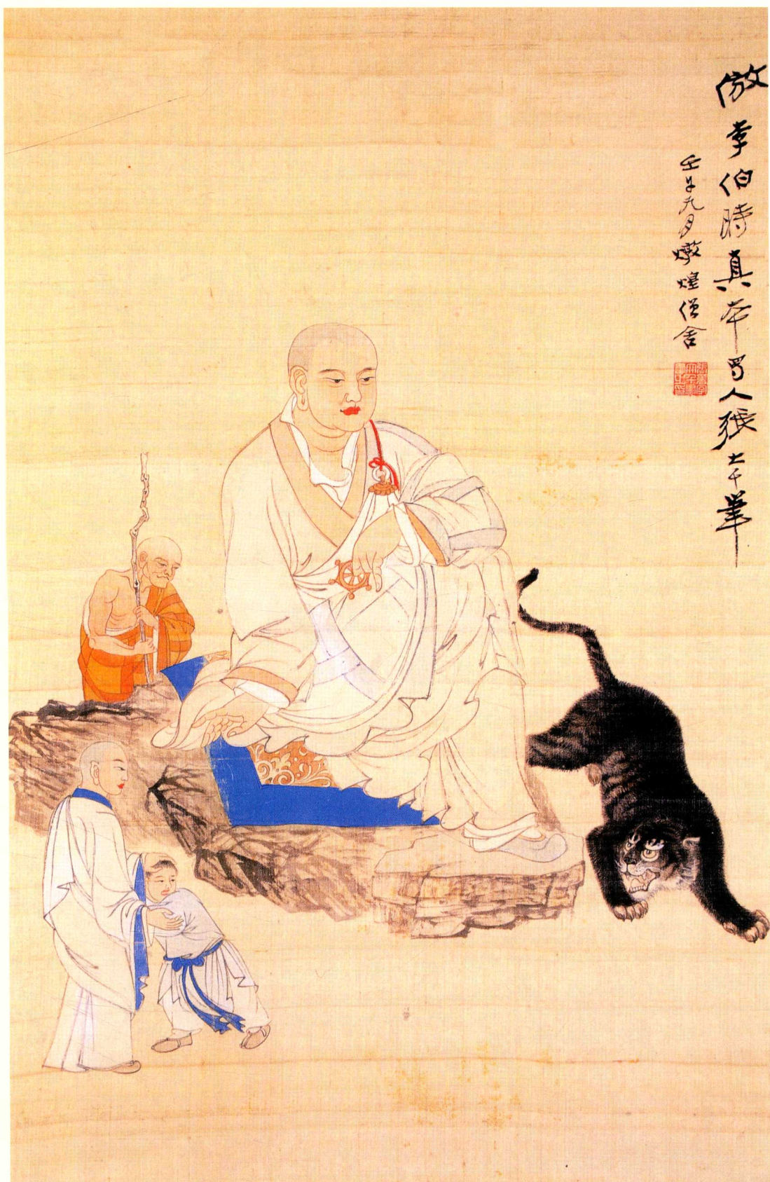
仿李伯时罗汉图轴